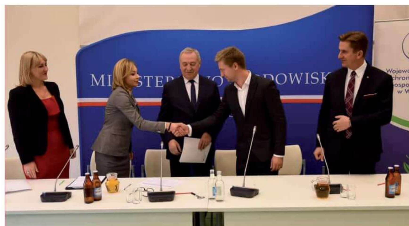
Podpisanie umowy na dofinansowanie Ścieżki Edukacji Ekologicznej.

rych można będzie prowadzić lekcje na świeżym powietrzu.