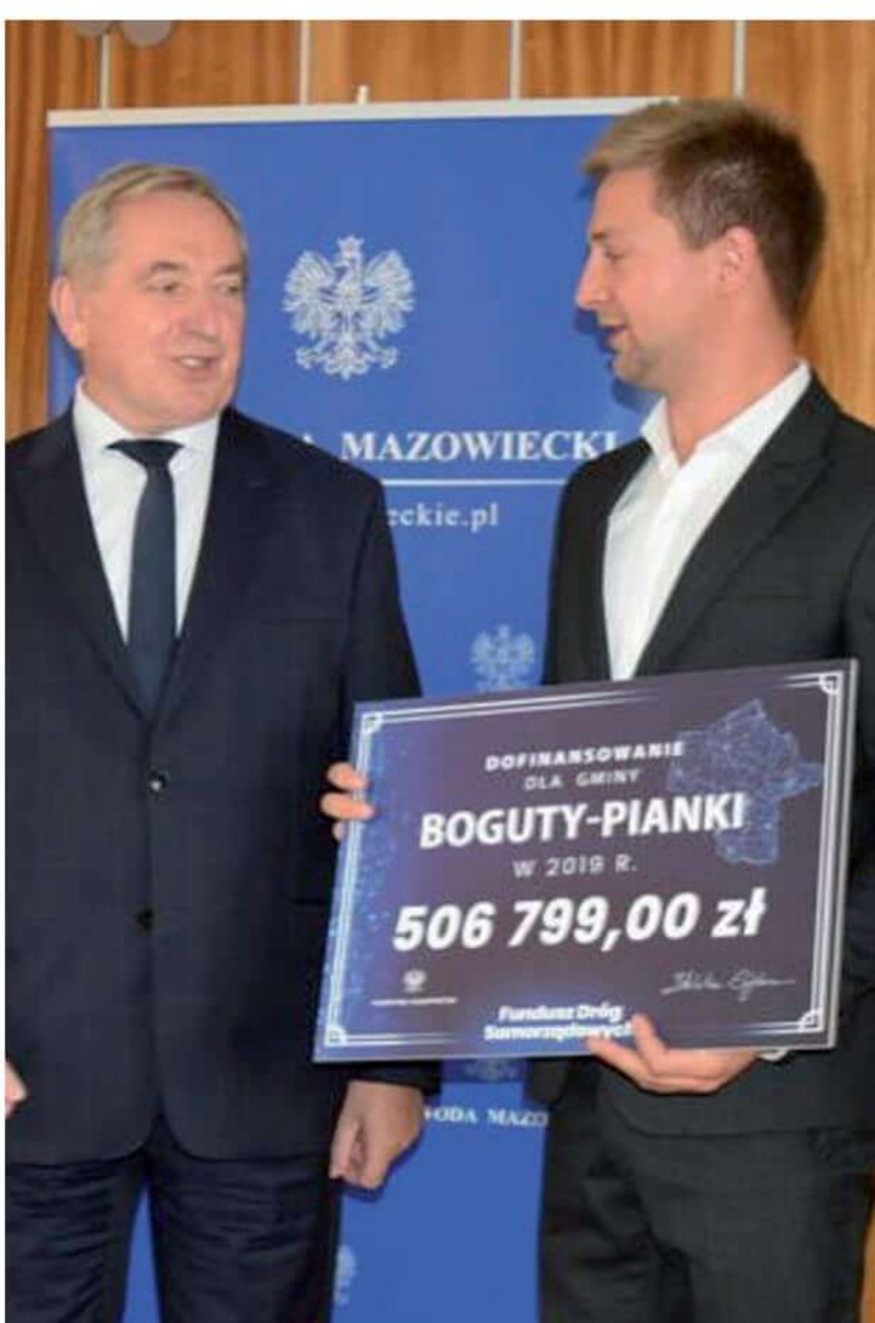
Uroczyste przekazanie dotacji na drogę w Tymiankach-Skórach.

Dobrym przykładem jest utwardzenie około 3,5 kilometrów odcinków dróg gminnych pozyskanym bezpłatnie destruktem asfaltowym. Przy okazji remontu drogi wojewódzkiej w Bogutach Wójt Gminy zwrócił się do Zarządu Województwa z wnioskiem o przekazanie tego materiału na potrzeby utwardzenia dróg gminnych. Dzięki pozytywnej decyzji zarządu mogliśmy wykorzystać ponad 2600 ton destruktu asfaltowego i podbudowy żwirowej na własne potrzeby. Szacowana wartość tego materiału to kilkaset tysięcy złotych. Do właściwego wykorzystania cennego surowca użyto specjalistycznego sprzętu czyli rozściełacza i walca drogowego, aby wykonane prace trwale i efektywnie poprawiły stan remontowanych odcinków. Jakość i standard prac przeszedł oczekiwa-