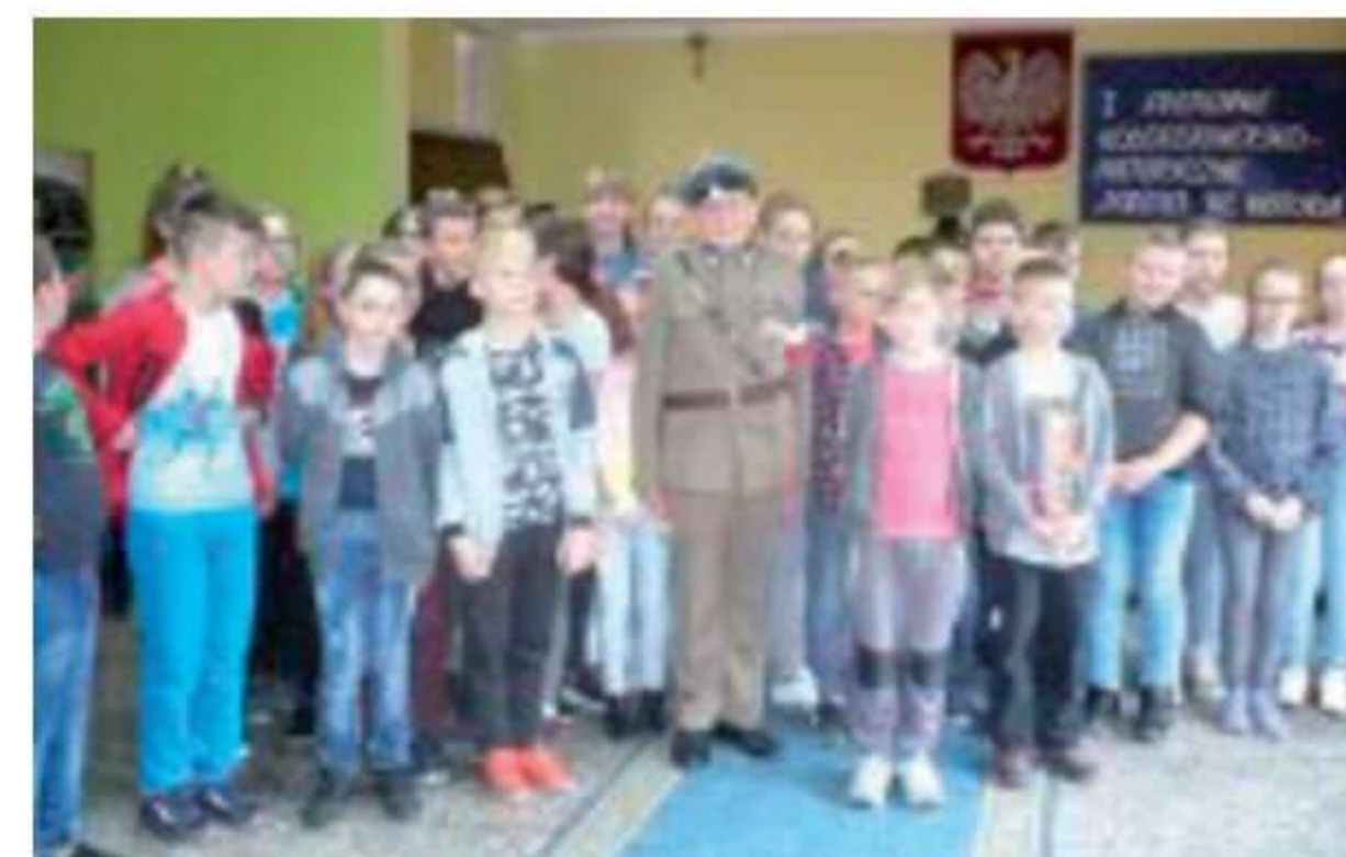
Uczniowie Szkoły Podstawowej w Bogutach.