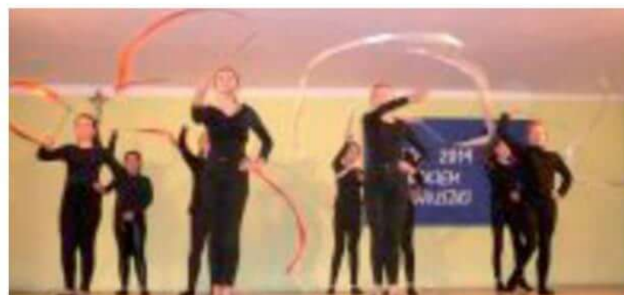
Grupa taneczna Szkoły Podstawowej w Tymiankach-Buciach.