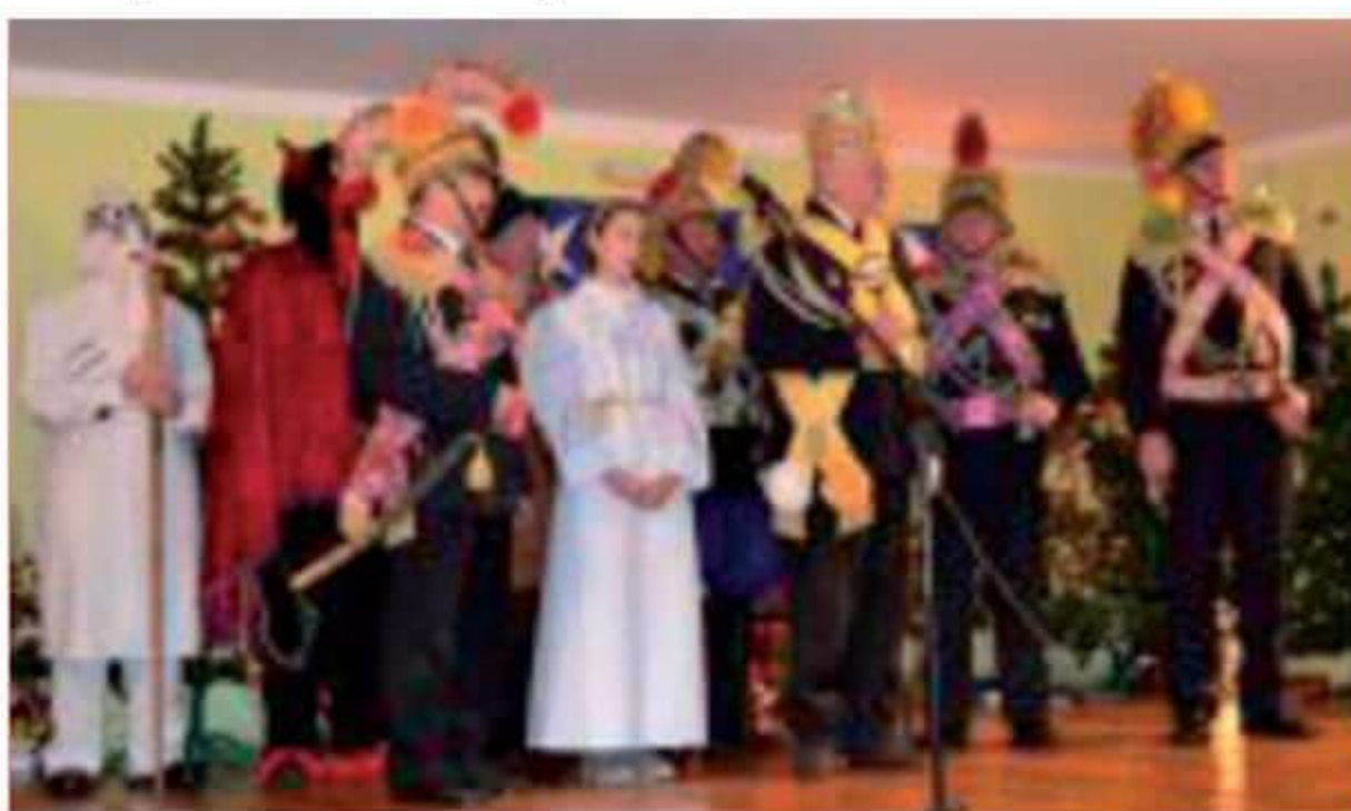
Zespół Kołędniczy Król Herod z Rosochatego .

czory od Bożego Narodzenia do Trzech Króli nazywano „Świątymi” i przeznaczone były na wspólne śpiewanie kolęd, chodzenie z szopką, gwiazdą i królem Herodem. Gdy gospodarz był hojny, dziękowano mu słowami: „Za gościnę dziękujemy, zdrowia, szczęścia winszujemy, na ten Nowy Rok”. I tak było na scenie Gminnego Ośrodka Kultury i Sportu w Bogutach-