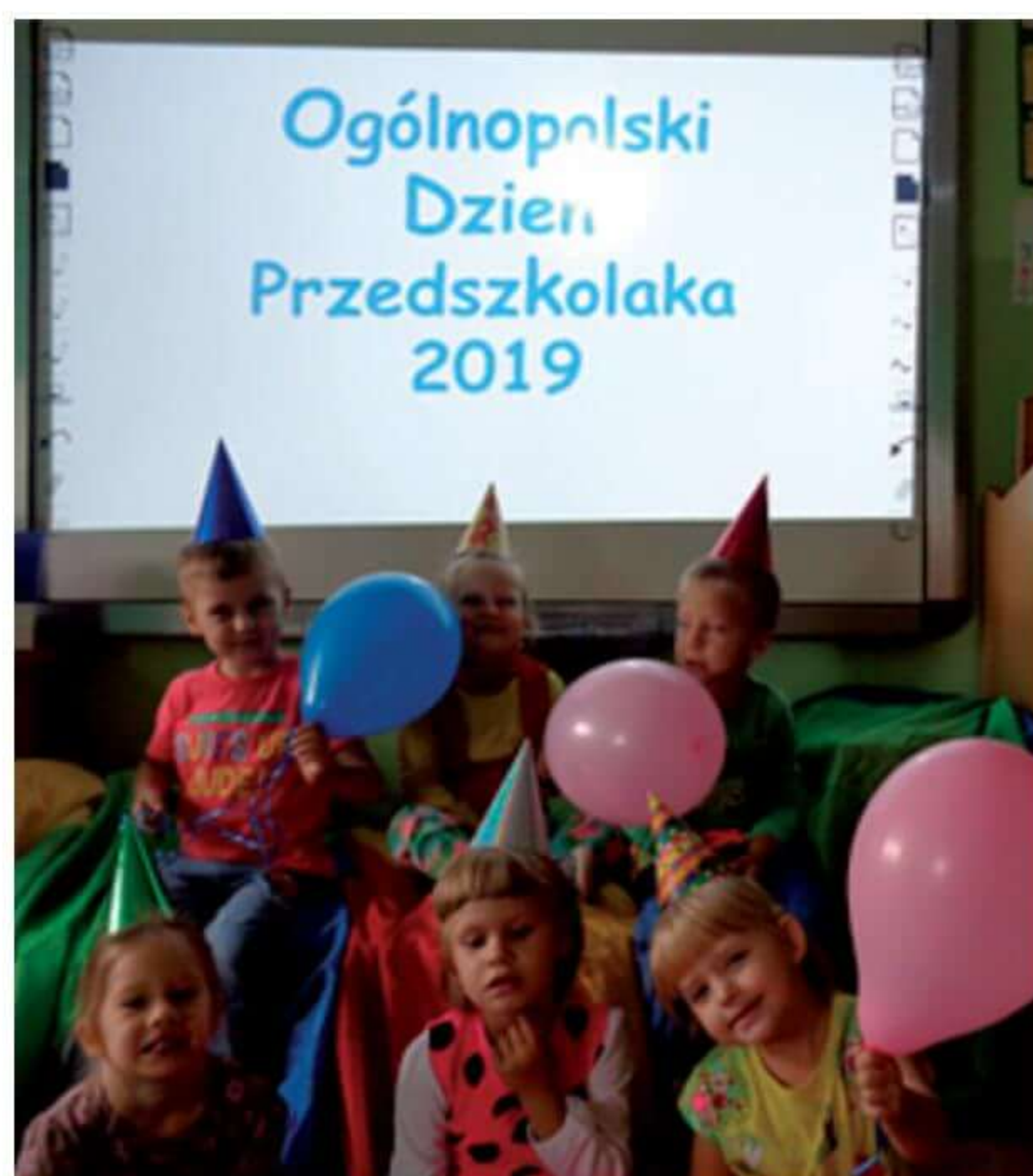
Dzień Przedszkolaka 2019.