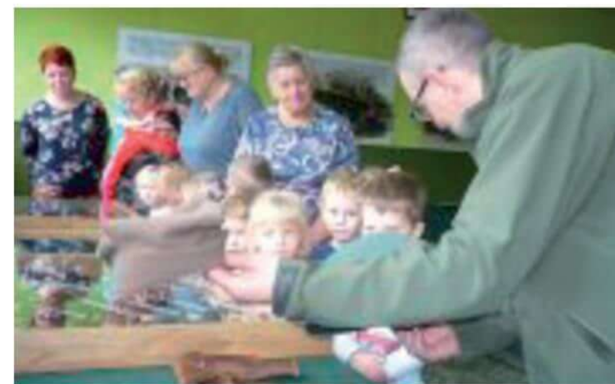
Dzieci oddziału przedszkolnego zwiedzają wystawę.

się wzruszającymi wspomnieniami z młodzieżą i dorosłymi mieszkańcami naszej gminy przybyłymi na spotkanie.