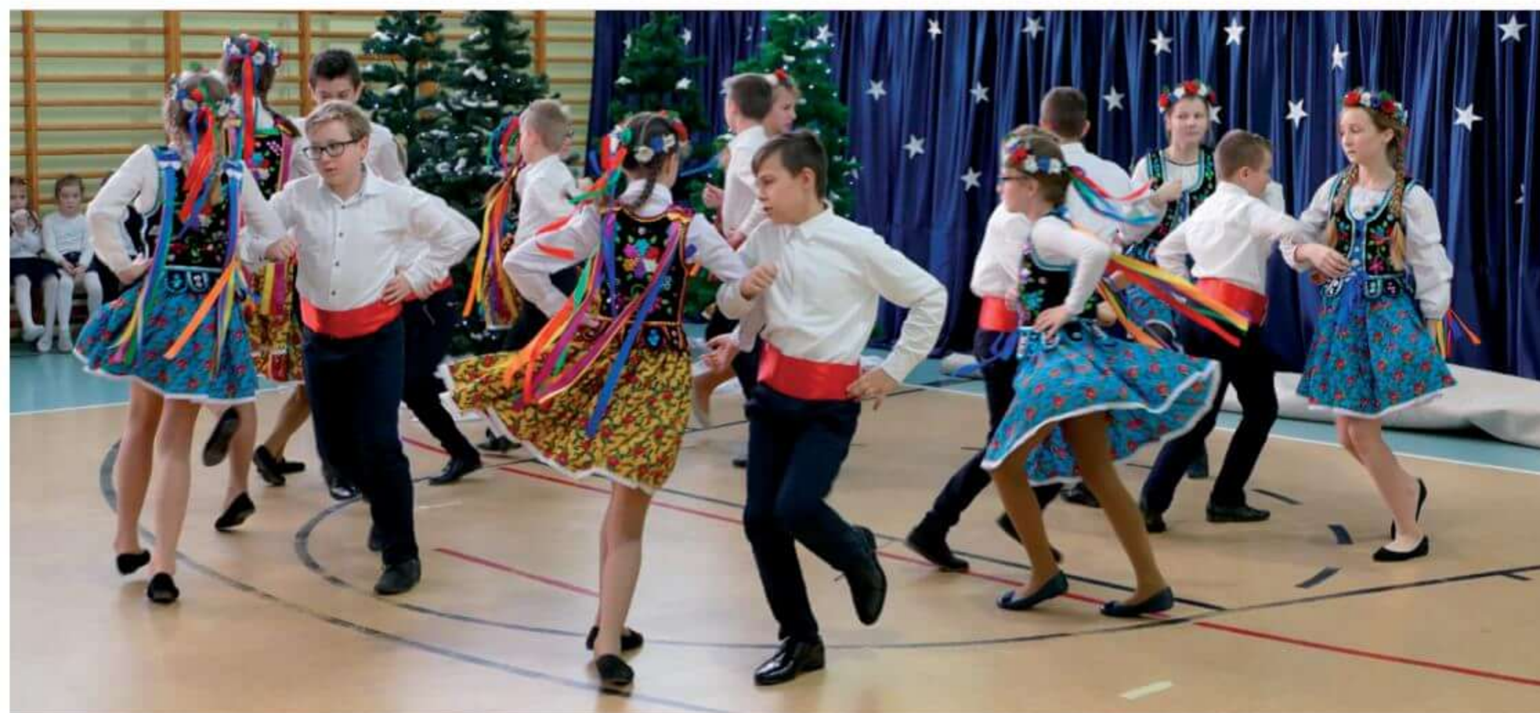
Zespół Pieśni i Tańca Mali Żurawiacy.

Wielki patron czuwa i wyznacza kierunek. Mieć takiego patrona to zaszczyt, ale i zobowiązanie, dlatego chcemy wprowadzać w życie i każdego dnia realizować nauczanie naszego Wielkiego Polaka – Ojca Świętego Jana Pawła II.