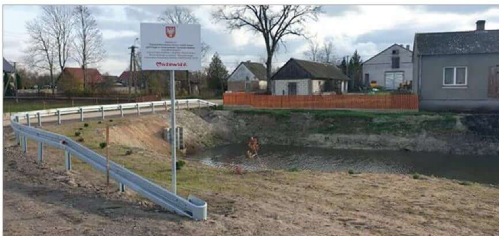
Inwestycja w ramach MIAS w Tymiankach-Adamach.