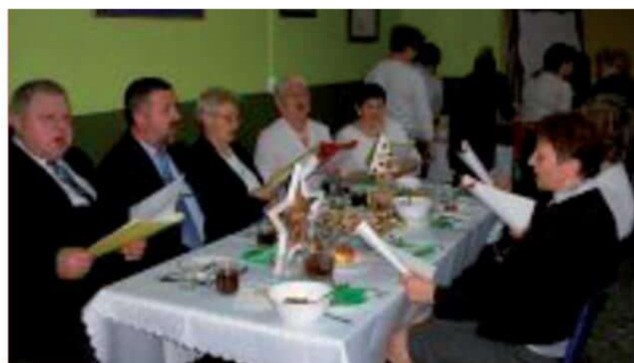
Koncert kolęd w wykonaniu zespołu Żurawiacy