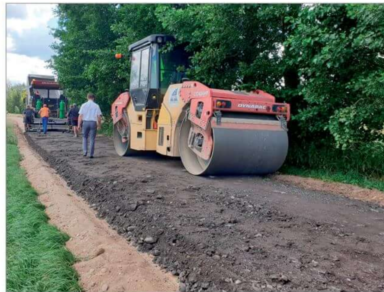
Remont drogi z użyciem destruktu asfaltowego.

nam się pozyskać w roku 2019 źródło finansowana poprzez Fundusz Dróg Samorządowych. Całkowity koszt inwestycji wyniesie ponad 600 tys. złotych z czego planowane dofinansowanie to 70% kosztów kwalifikowanych. Z pośród 5 oferentów wyłoniono wykonawcę, którą została firma P.W. WIKRUSZ z Miedznej. Podpisana z wykonawcą umowa opiewa na kwotę 599 641,21 zł i jest o około 120 tysięcy mniejsza od pierwotnie planowanej. Na dzień dzisiejszy inwestycja została zakończona.