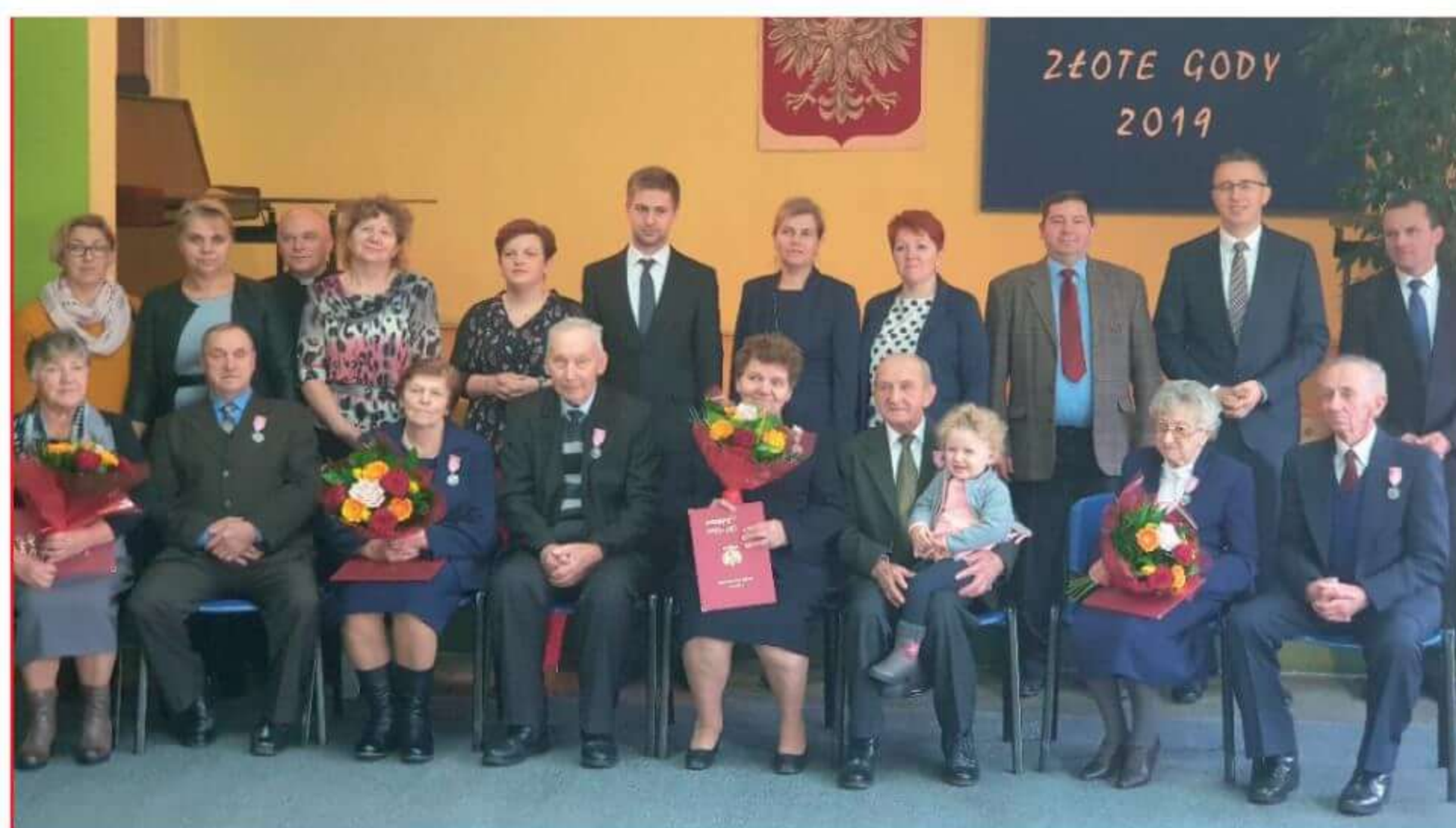
Pary świętujące swoje Złote Gody.