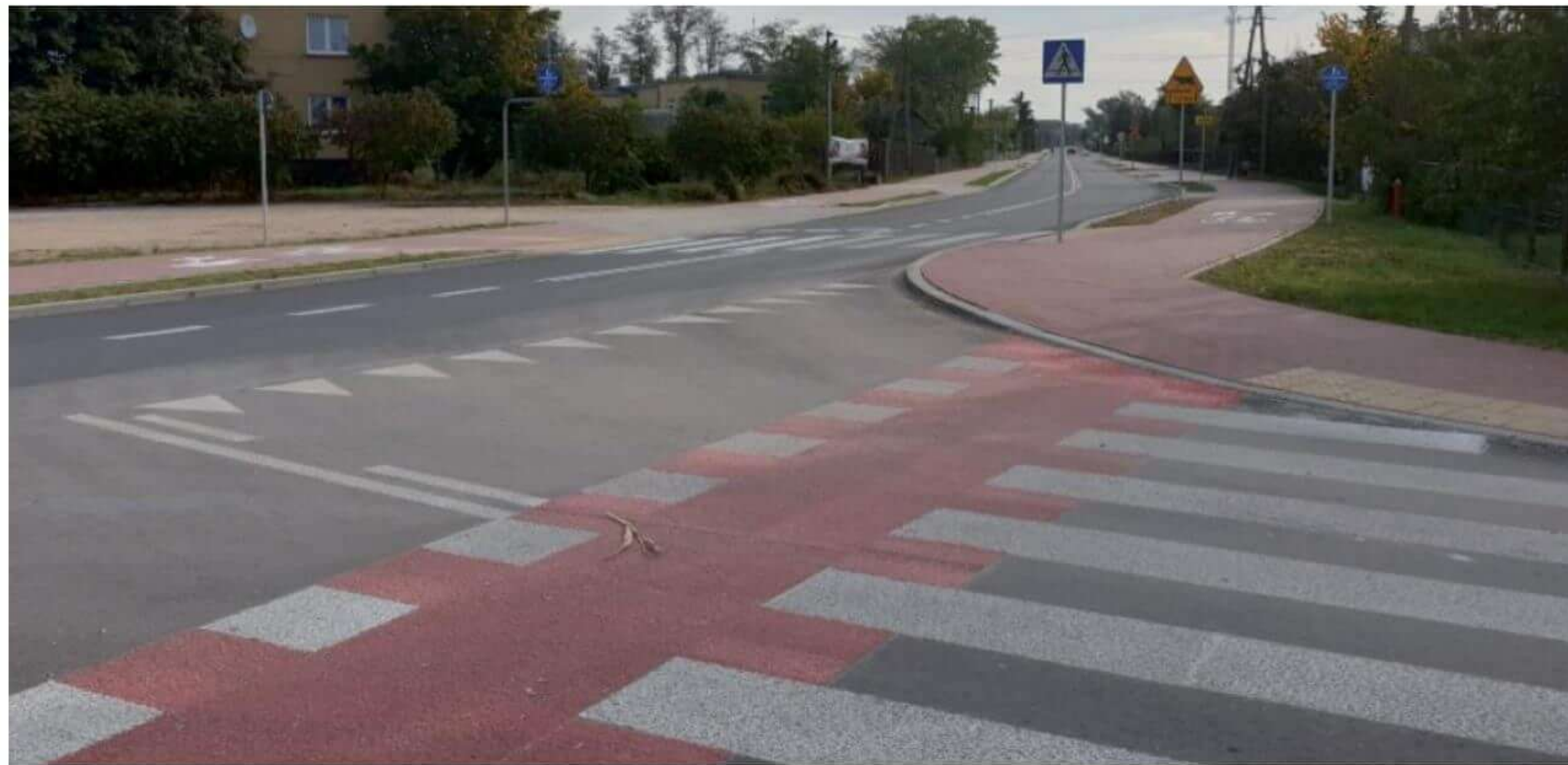
Droga wojewódzka w Bogutach-Piankach.

nia wielu osób, czego efektem było zgłaszanie kolejnych odcinków, na których mogłaby być wykorzystana taka technologia. Ostatecznie utwardzone odcinki dróg: