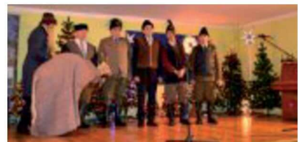
Zespół Kołędniczy Z Kozą z Wyszonek Błoni