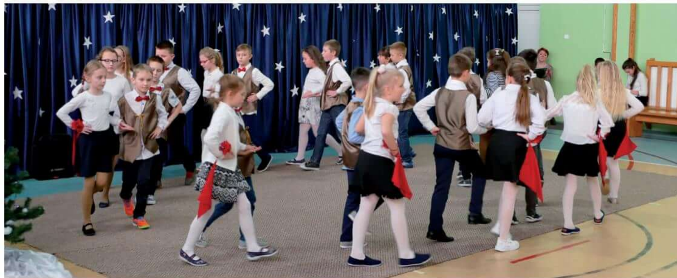
Występy uczniów podczas Dnia Babci i Dziadka.