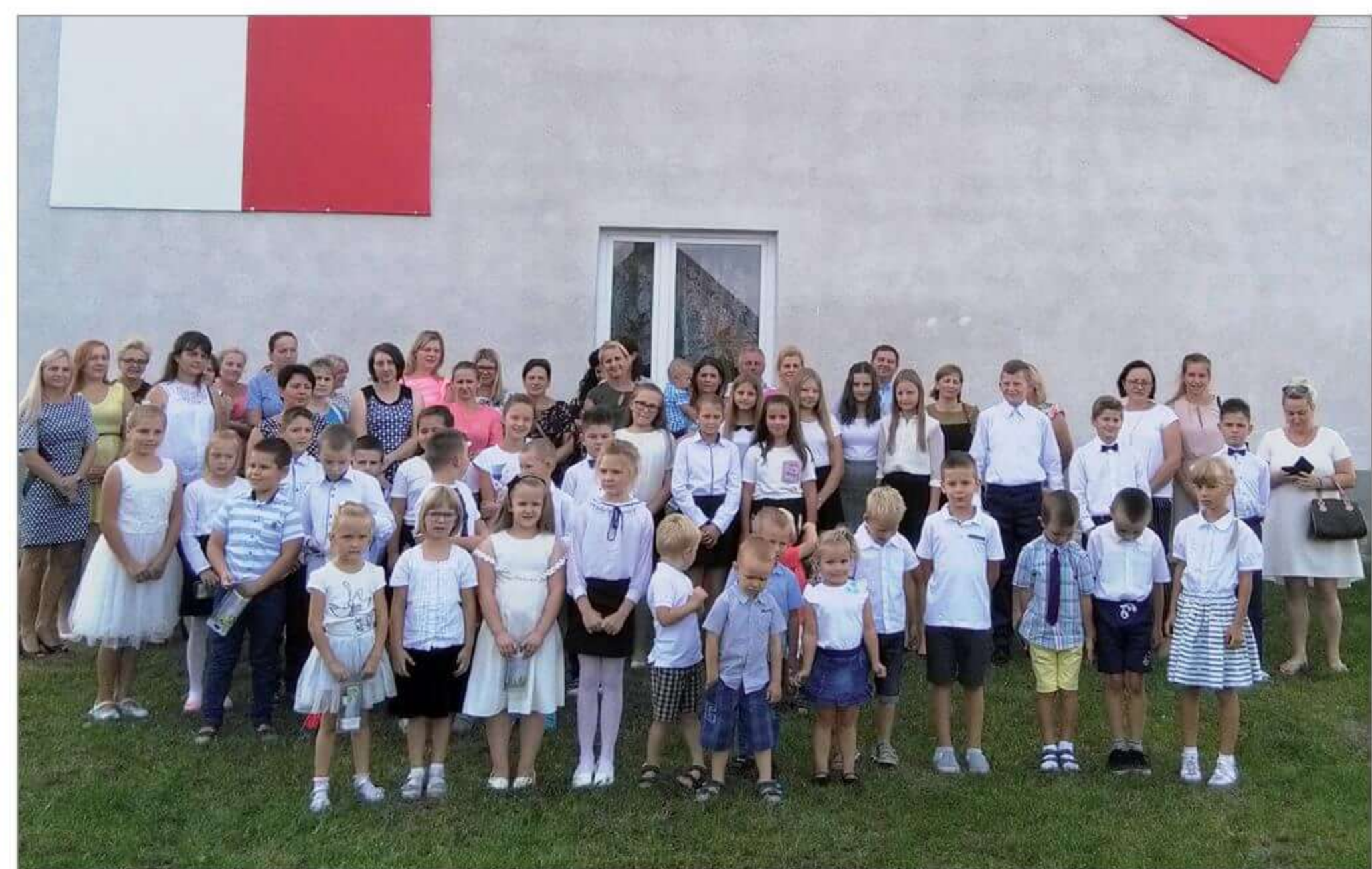
Obchody 100 Rocznicy Odzyskania Niepodległości.