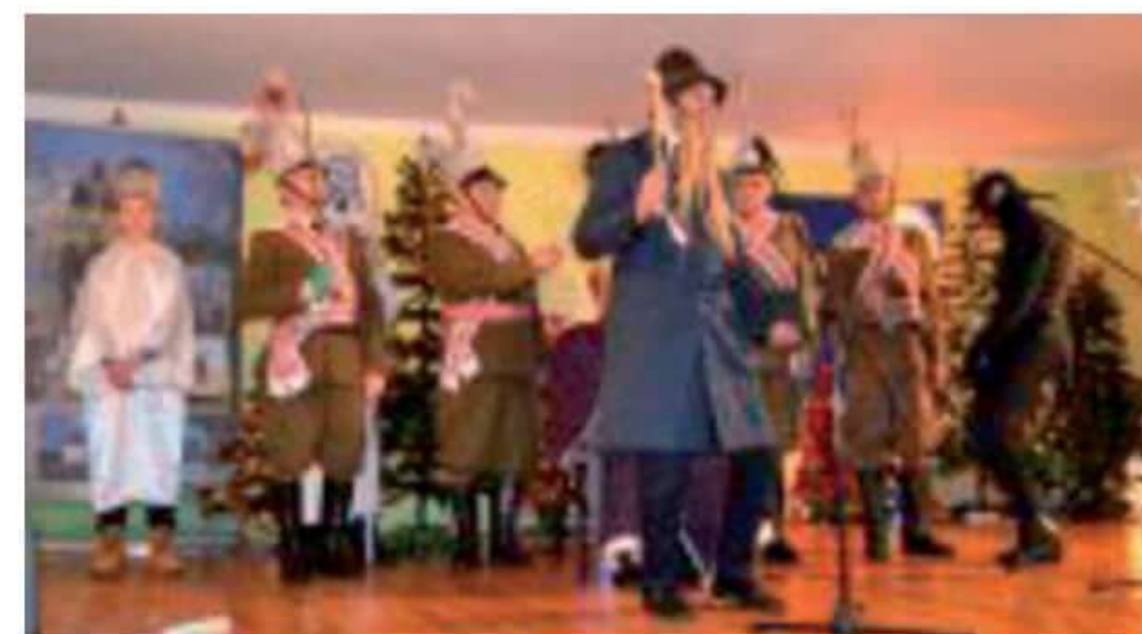
Zespół Kołędniczy Król Herod z Wyszonek Błoni.

Patronem spotkania był Powiat Ostrowski, który udzielił wsparcia finansowego na organizację uroczystości. Jak co roku sala widowiskowa nie mogła wszystkich pomieścić. Od lat wierni widzowie przybywają z różnych zakątków regionu aby podziwiać amatorskie teatry obrzędowe i wspólnie kołędować.