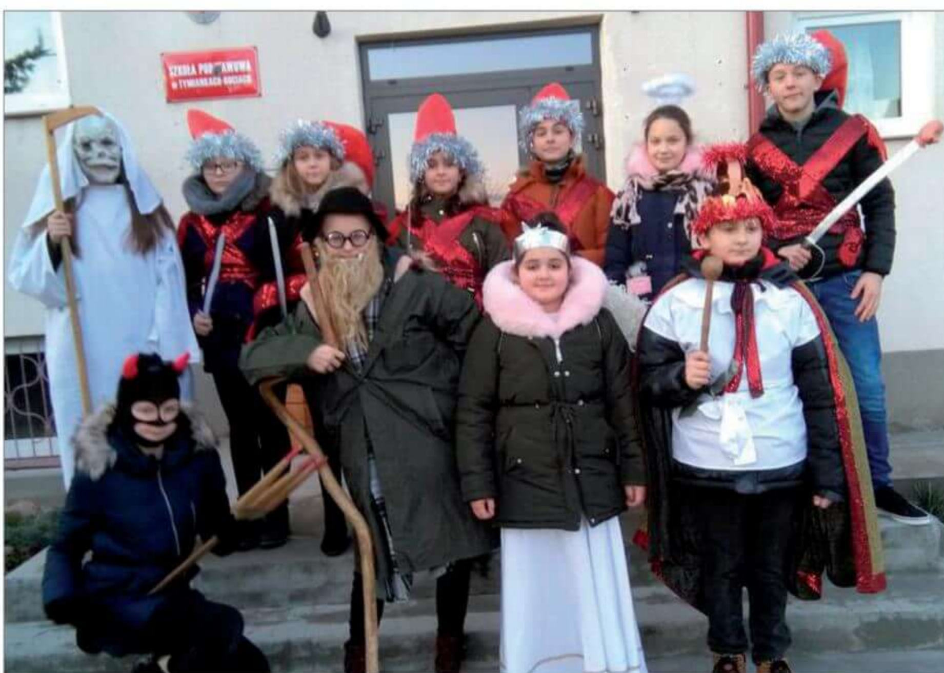
Zespół Kolędniczy Herody działający przy szkole.

logopedycznej, uczęszczają na zajęcia artystyczne oraz uspołeczniające i integrujące grupę. Organizowane są wycieczki krajoznawcze, imprezy edukacyjne i środowiskowe. Najbardziej znanymi są Wieczornica Patriotyczna z okazji 11 listopada oraz Noc Sów. Budynek szkolny – klasy i korytarze zostały odnowione staraniami rodziców. Co roku przybywa nowoczesnego sprzętu dydaktycznego. Szkoła od wielu lat współpracuje ze szkołą z Warszawy oraz wszystkimi instytucjami z terenu gminy.