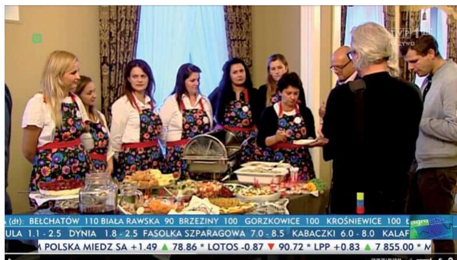
Członkinie KGW z wizytą w TVP.

Członkinie KGW nie tylko gotują. Zorganizowały dla chętnych warsztaty z kosmetyką, uczą się wyszywać, szydełkować oraz dbają o zdrowie. Przygotowują elementy do stroików świątecznych.