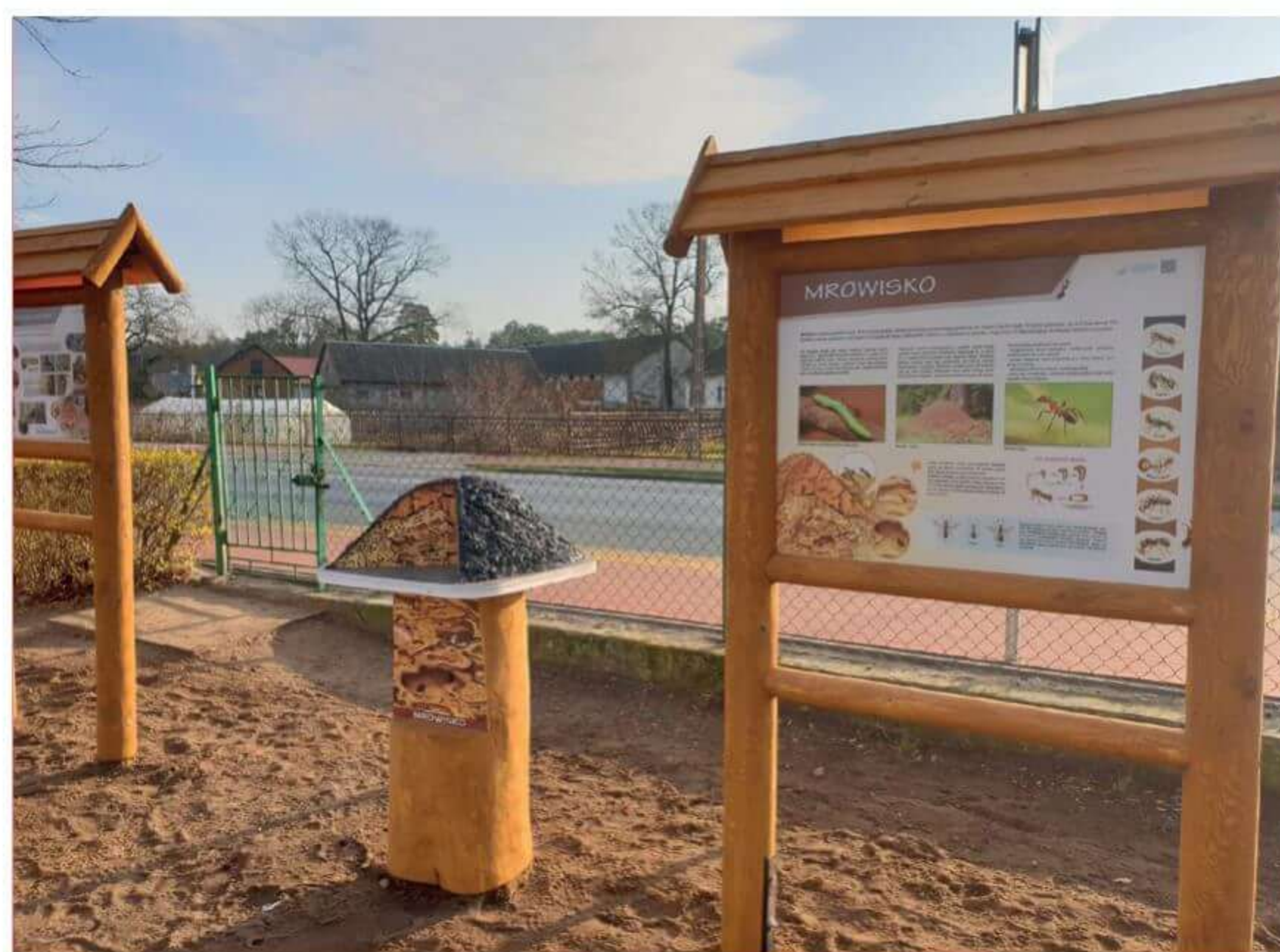
Ścieżka Edukacji Ekologicznej w Bogutach-Piankach.

Ważnym elementem dopełniającym całość są nasadzenia roślin wieloletnich. Miejsce to stanowić będzie całość tworzącą warunki do ekologicznej edukacji, promocji właściwych zachowań i kultury ekologicznej. Przyroda otaczająca dane przedsięwzięcie stanowić będzie bazę zajęć terenowych, na których głównie będzie opierała się edukacja ekologiczna.