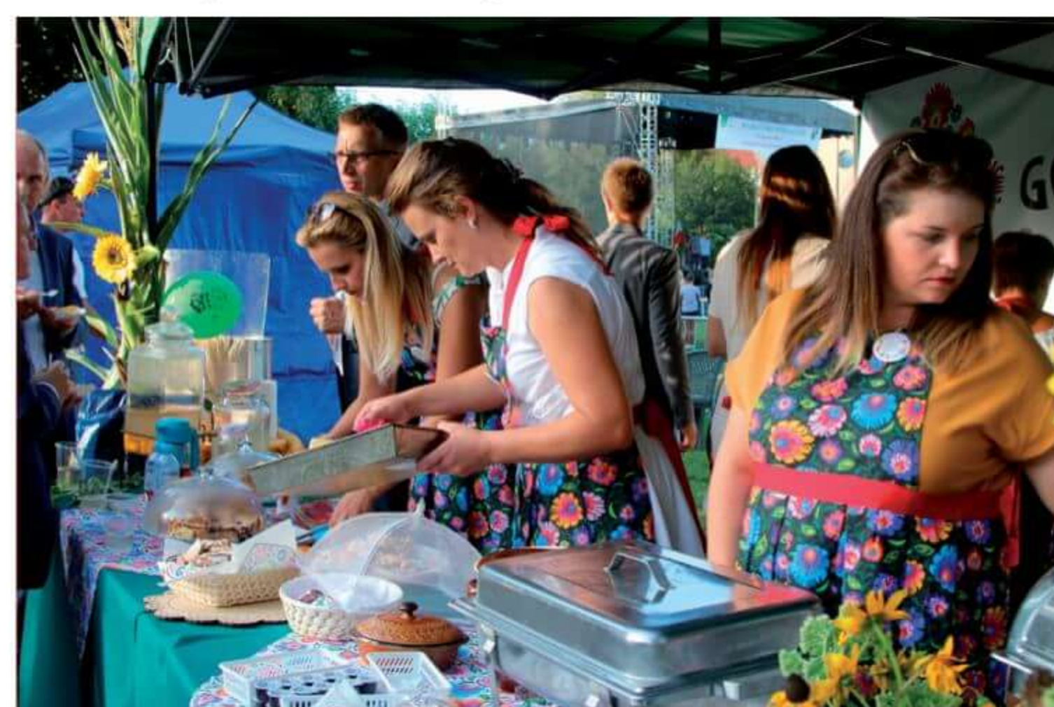
Dożynki powiatowe w Ostrowi Mazowieckiej.

KGW mogło organizować spotkania integracyjne dla mieszkańców oraz czynnie włączyć się w festyny i imprezy plenerowe organizowane w okolicy. Oprócz spotkania dla rodzin, sympatyków i mieszkańców przy grillu i ognisku, członkinie pierwszy raz promowały organizację na Nocy Muzeów w Ciechanowcu, gdzie częstowały domowymi ciastami.