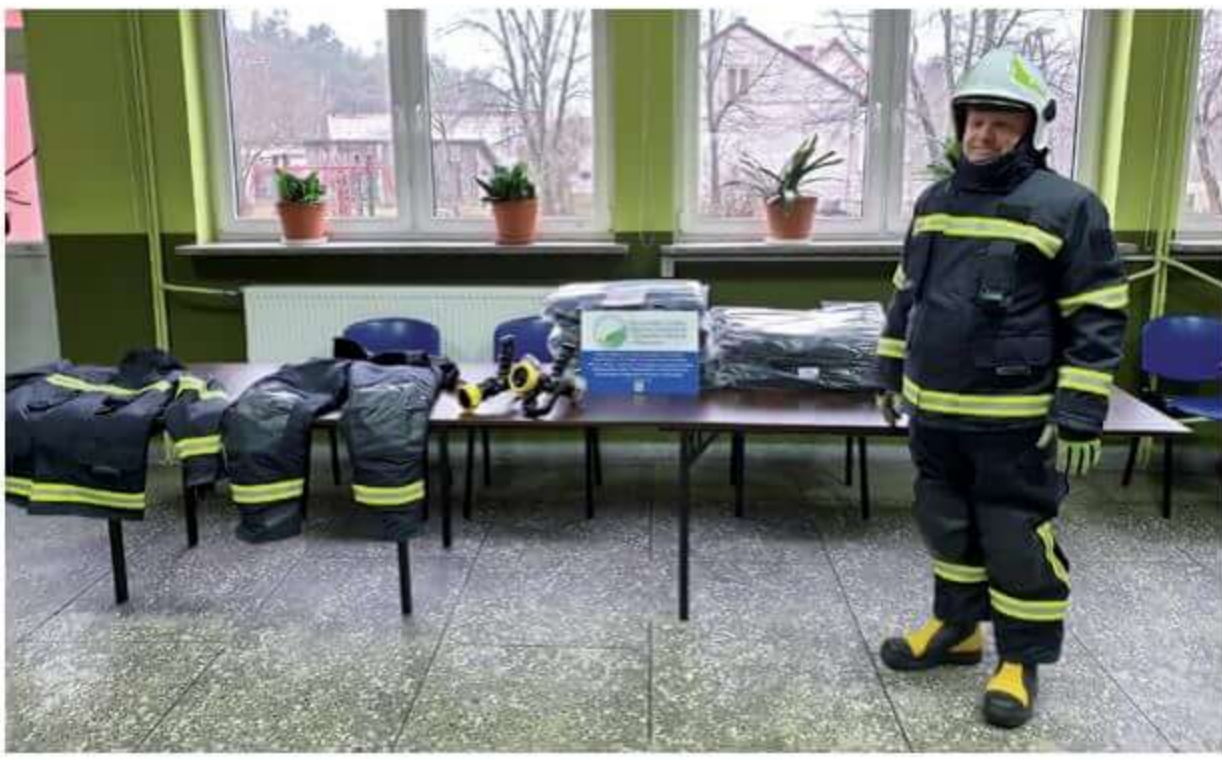
Sprzęt zakupiony dla naszej jednostki dzięki wsparciu Wojewódzkiego Funduszu Ochrony Środowiska i Gospodarki Wodnej w Warszawie.

gdzie zaprezentowali sprzęt jaki znajduje się na wyposażeniu jednostki. We wrześniu jednostka OSP Boguty-Pianki brała udział w XI Powiatowych Zawodach Sportowo-Pożarniczych, w których zajęła V miejsce na dziesięć drużyn startujących. Również we wrześniu strażacy pomagali w organizacji i zabezpieczeniu festynu „Spotkanie pod wiatrakiem” w Drewnowie-Ziemkach. W listopadzie strażacy uczestniczyli we Mszy Świętej za zmarłych strażaków z powiatu ostrowskiego, której gospodarzem była parafia Andrzejewo.