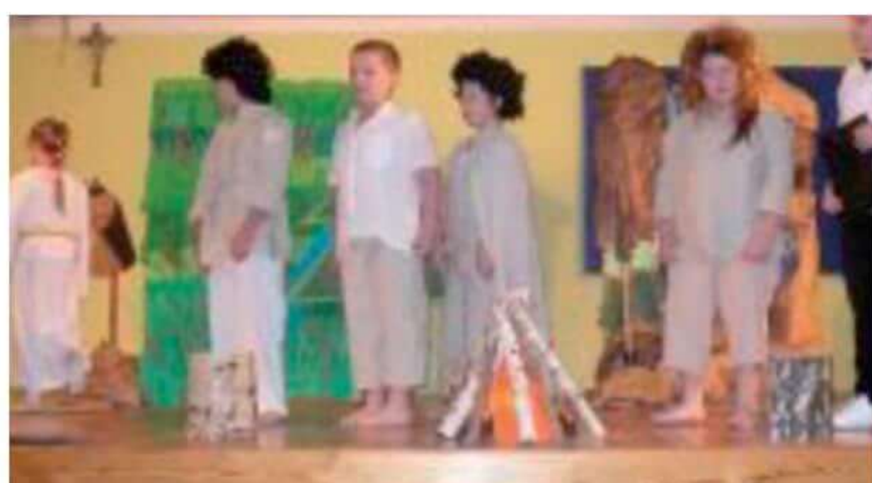
Inscenizacja legendy o początkach państwa polskiego w wykonaniu uczniów kl. I z Bogut.

Obchody rozpoczęły się uroczystą Mszą Św. za Ojczyznę odprawioną w kościele parafialnym pod wezwaniem Wszystkich Świętych w Bogutach-Piankach. Następnie delegacja władz samorządowych na czele z Panem Wójtem Gminy udała się na mogiłę żołnierską przy ulicy Wiejskiej, by złożyć kwiaty.