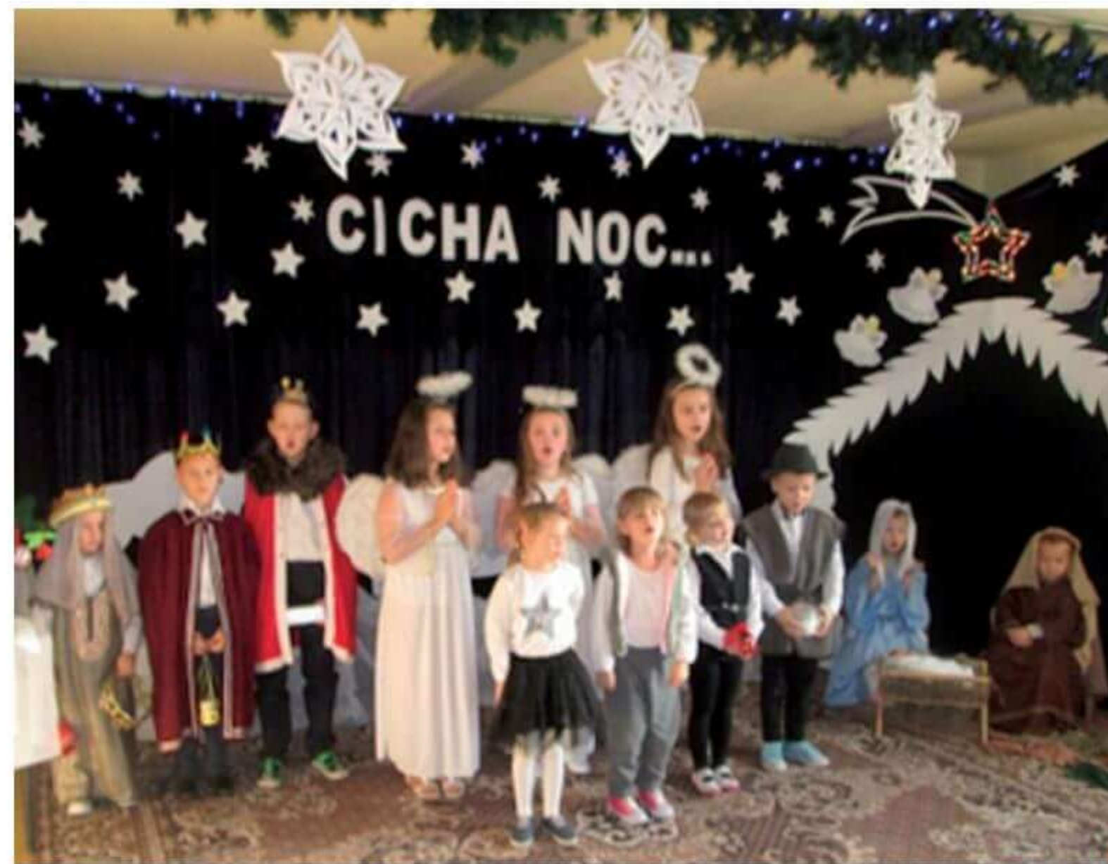
Wigilia Szkolna 2019.

Chociaż od lat zajęcia prowadzone są w klasach łączonych, to nasi absolwenci przechodząc kolejne etapy kształcenia odnoszą sukcesy edukacyjne, a następnie zawodowe, jako adwokaci, lekarze, farmaceuci, inżynierowie, nauczyciele.