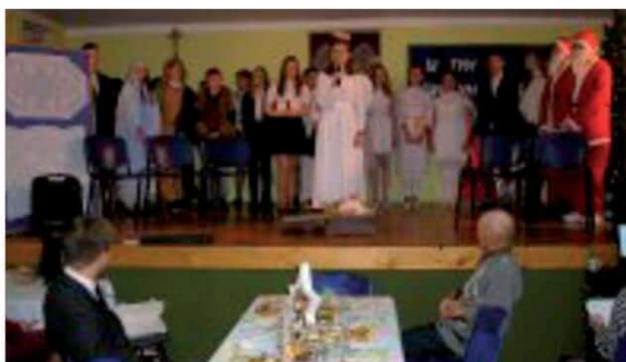
Występ uczniów Szkoły Podstawowej w Bogutach-Piankach