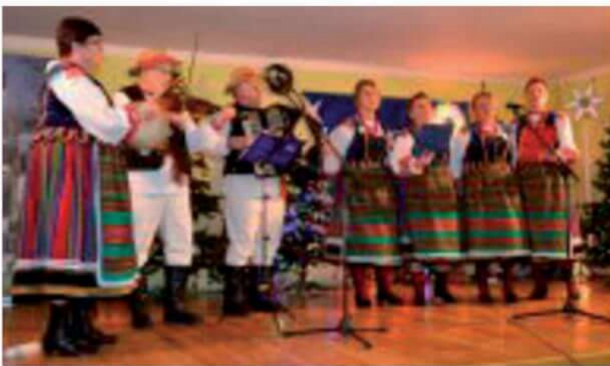
Zespół Ludowy Laskowianki .

Tradycyjnie 6 stycznia o godzinie 17.00 rozpoczęło się spotkanie kołędnicze w Gminnym Ośrodku Kultury i Sportu w Bogutach-Piankach. Głównym celem tego wydarzenia jest podtrzymywanie bożonarodzeniowych tradycji kołędowania i odwiedzania domów przez grupy kołędników. Wie-