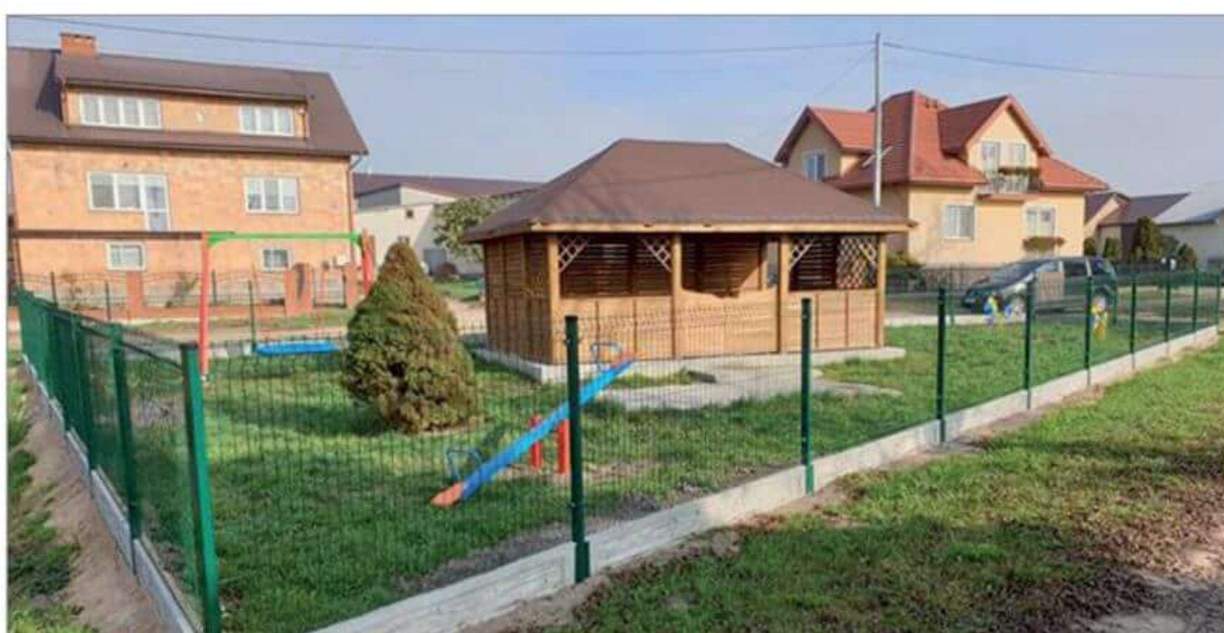
Inwestycja w ramach MIAS w Godlewie-Łubach.