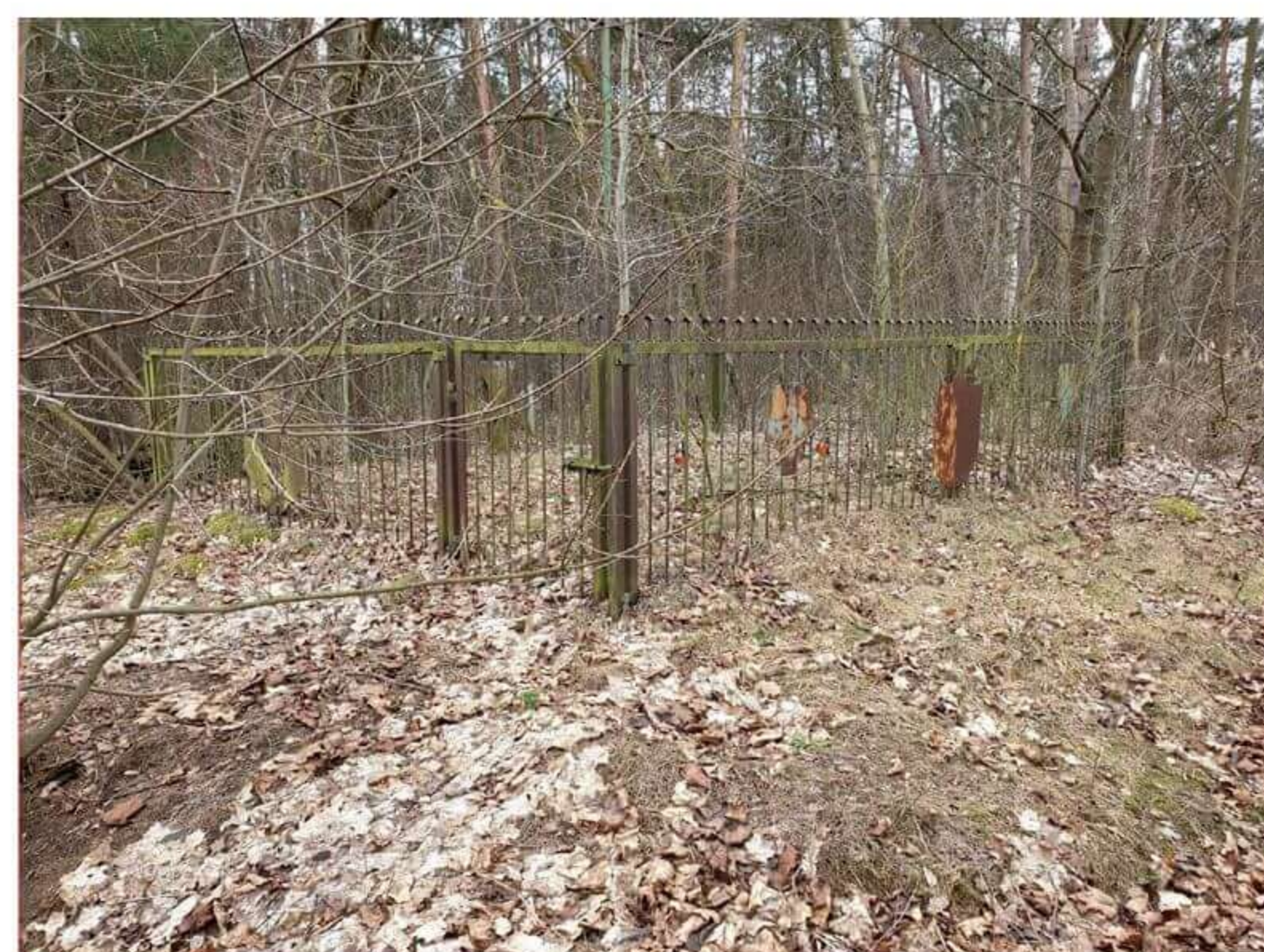
Mogiła z lat 1914-1920 w miejscowości Trynisz Moszewo.

siatki czy setki lat temu walczyli i przelewali krew, byśmy mogli żyć nie znając tragedii wojny. Przykładem takiego strażnika pamięci jest mogiła na granicy Bogut i Trynisz. Pierwotnie zgodnie z istniejącymi dokumentami był to niemiecki cmentarz wojenny z I Wojny Światowej. Frontowa pożoga dotarła tu