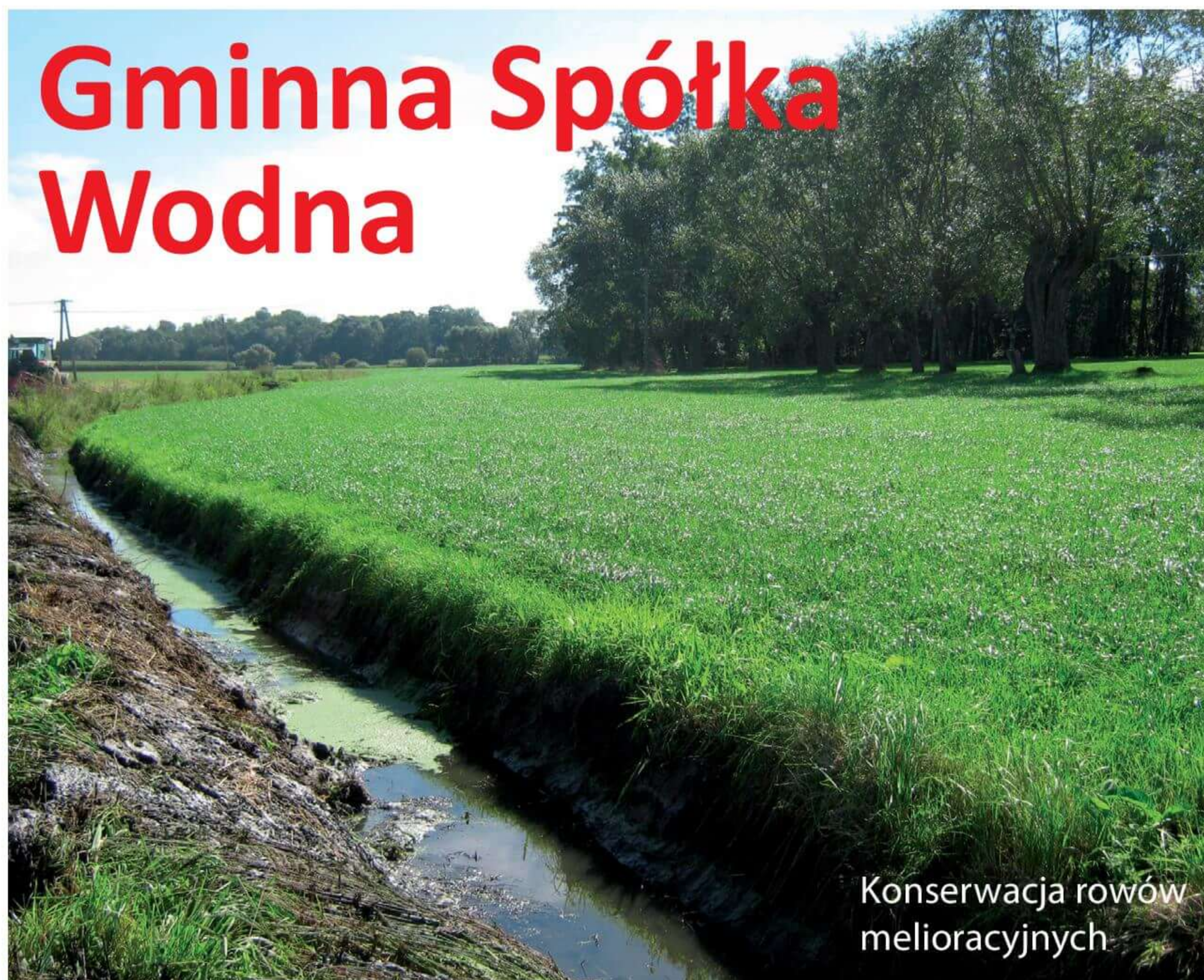
Konserwacja rowów melioracyjnych

Gminna Spółka Wodna BOGUTY ma za zadanie utrzymanie i eksploatację urządzeń melioracyjnych szczegółowych na terenie gminy Boguty-Pianki. Jej działalność przyczynia się do poprawy stanu urządzeń melioracyjnych. Sprawne urządzenia mają znaczący wpływ na regulację stosunków wodnych w glebie, a tym samym wpływa to na wzrost plonów.