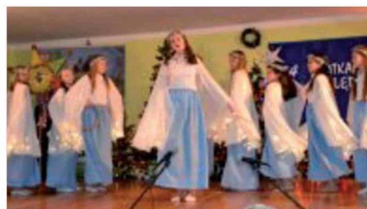
Uczniowie Szkoły Podstawowej w Tymiankach- Buciach