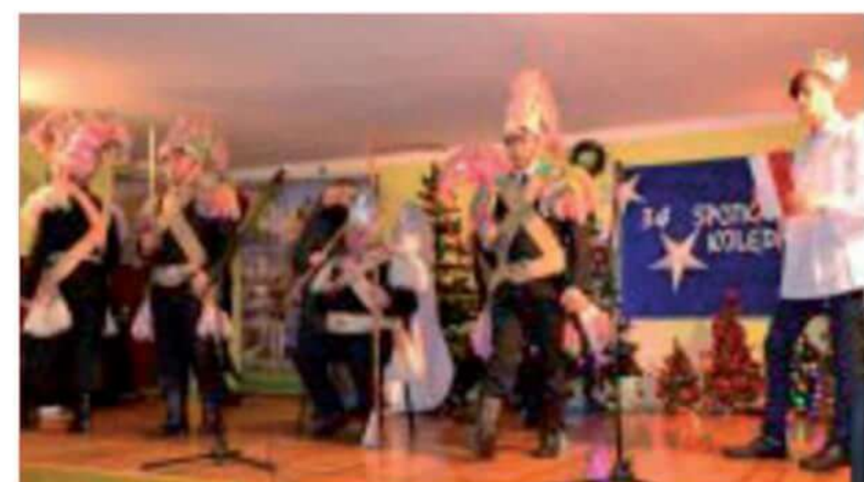
Zespół Kołędniczy Herody z Bogut-Pianek

Patronem spotkania był Powiat Ostrowski, który udzielił wsparcia finansowego na organizację uroczystości. Jak co roku sala widowiskowa nie mogła wszystkich pomieścić. Od lat wierni widzowie przybywają z różnych zakątków regionu aby podziwiać amatorskie teatry obrzędowe i wspólnie kołędować.