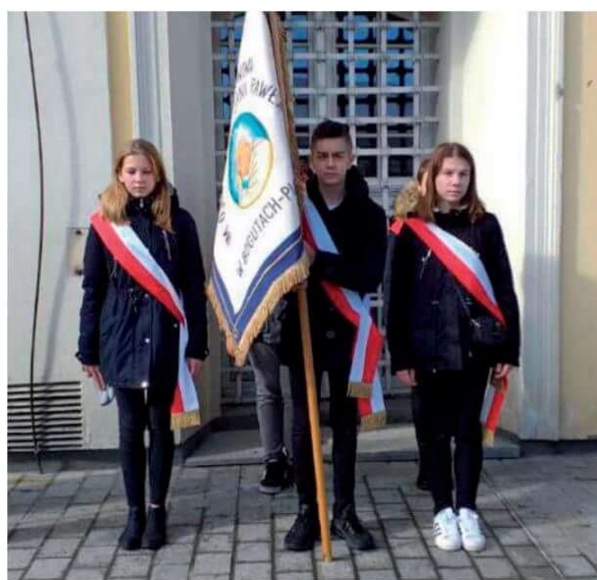
XIX Ogólnopolska Pielgrzymka Rodziny Szkół im. Jana Pawła II na Jasną Górę

Szkoła to także wychowanie budowanie więzi. Zapraszanie babć i dziadków na uroczystość z okazji ich święta jest tradycją na stałe wpisaną w repertuar imprez szkolnych. Święto Babci i Dziadka to dzień niezwykły, nie tylko dla dzieci, ale przede wszystkim dla babć i dziadków. To dzień pełen uśmiechów, wzruszeń i radości. Ta wspaniała impreza odbywa się zawsze w okolicach 20 stycznia. W trakcie uroczystości babcie i dziadkowie mogą podziwiać swoje pociechy w różnych formach artystycznych. Mali artyści z przejęciem odtwarzają swoje role, a czcigodni goście ze wzruszeniem odbierają czułe