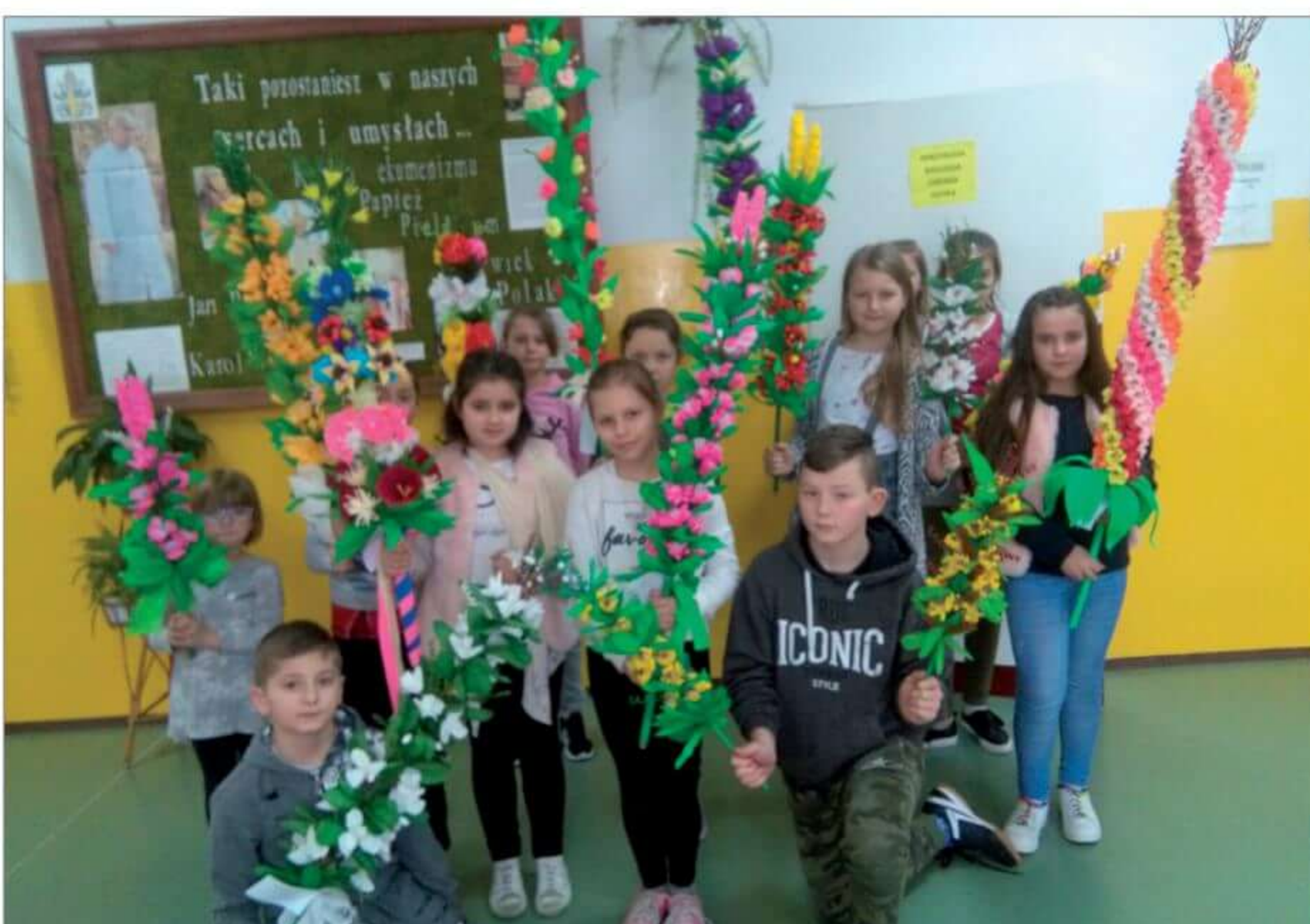
Uczniowie z własnoręcznie wykonanymi palmami.