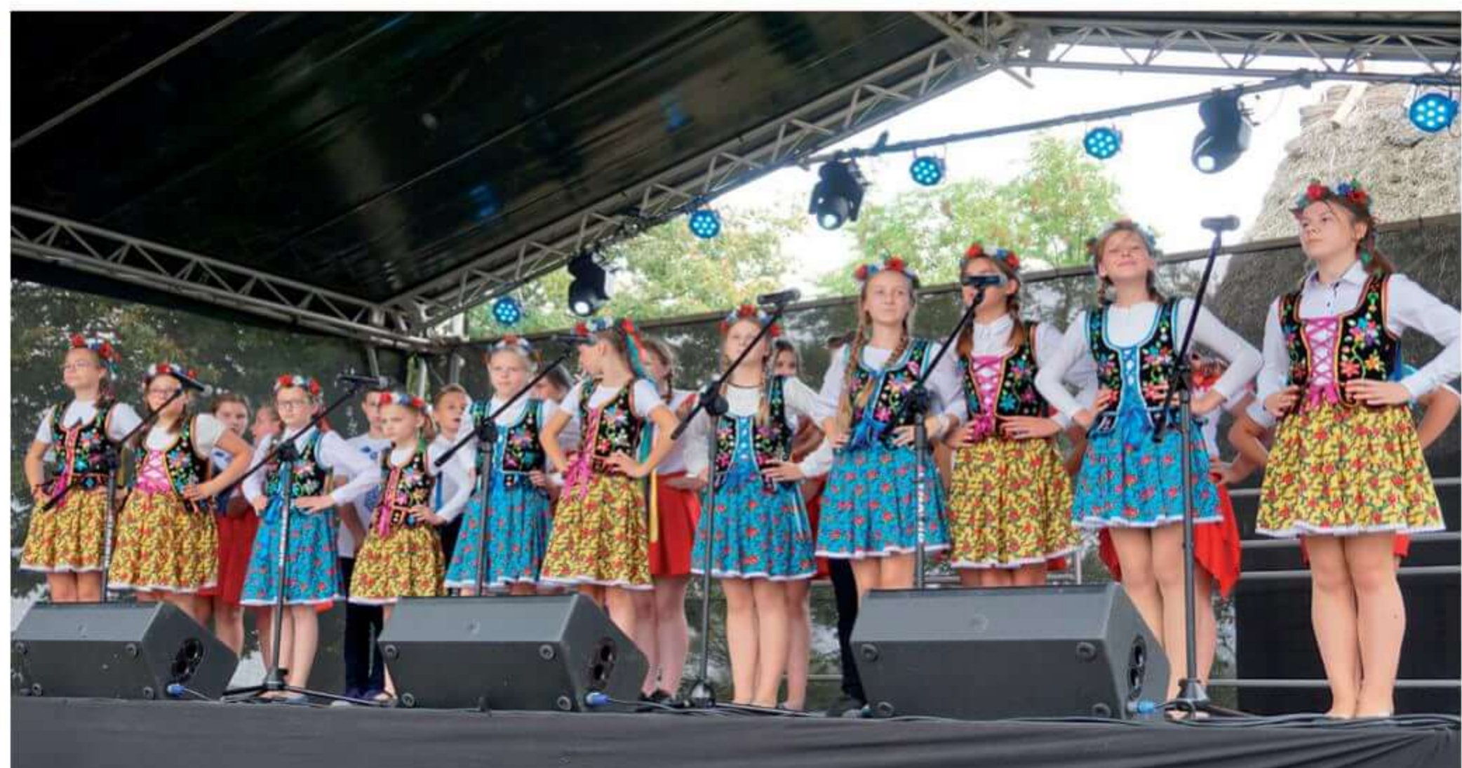
Występ Zespołu Mali Żurawiacy.