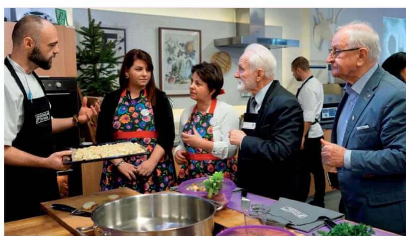
Warsztaty kulinarne w Food Lab Studio.

Członkinie specjalizują się w przygotowaniu regionalnych dań: baby, kiszki ziemniaczanej, różnego rodzaju pierogów, bigosu, kompotów, tradycyjnych ciast oraz bezalkoholowego piwa jałowcowego. KGW podjęło współpracę z LGD Zielone Sioło i 24 X uczestniczyło w warsztatach serowarskich w Lubiejewie Starym.