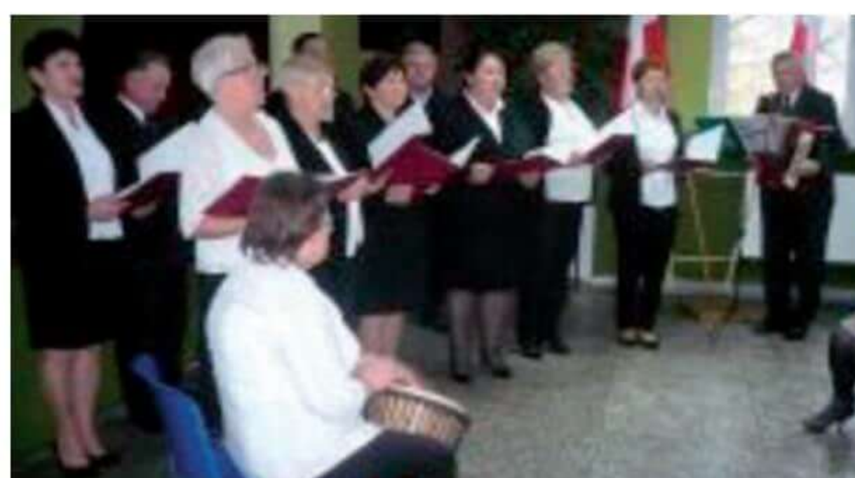
Koncert pieśni patriotycznych - zespół Żurawiacy.

To wspólne spotkanie w dniu narodowego święta uświadomiło wszystkim zgromadzonym jakim wielkim dobrem jest niepodległość naszego kraju, za którą nasi przodkowie przelewali krew.