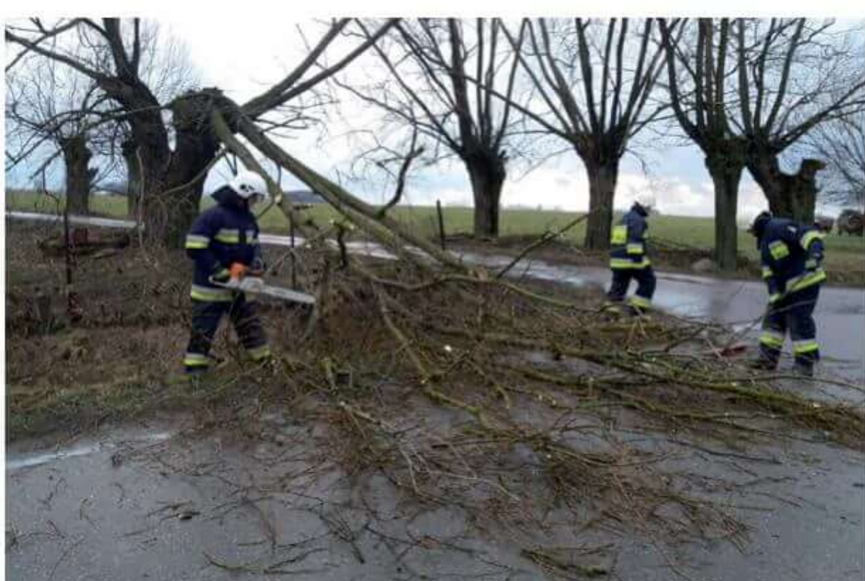
Strażacy podczas akcji usuwania powalonych drzew.

gdzie zaprezentowali sprzęt jaki znajduje się na wyposażeniu jednostki. We wrześniu jednostka OSP Boguty-Pianki brała udział w XI Powiatowych Zawodach Sportowo-Pożarniczych, w których zajęła V miejsce na dziesięć drużyn startujących. Również we wrześniu strażacy pomagali w organizacji i zabezpieczeniu festynu „Spotkanie pod wiatrakiem” w Drewnowie-Ziemkach. W listopadzie strażacy uczestniczyli we Mszy Świętej za zmarłych strażaków z powiatu ostrowskiego, której gospodarzem była parafia Andrzejewo.