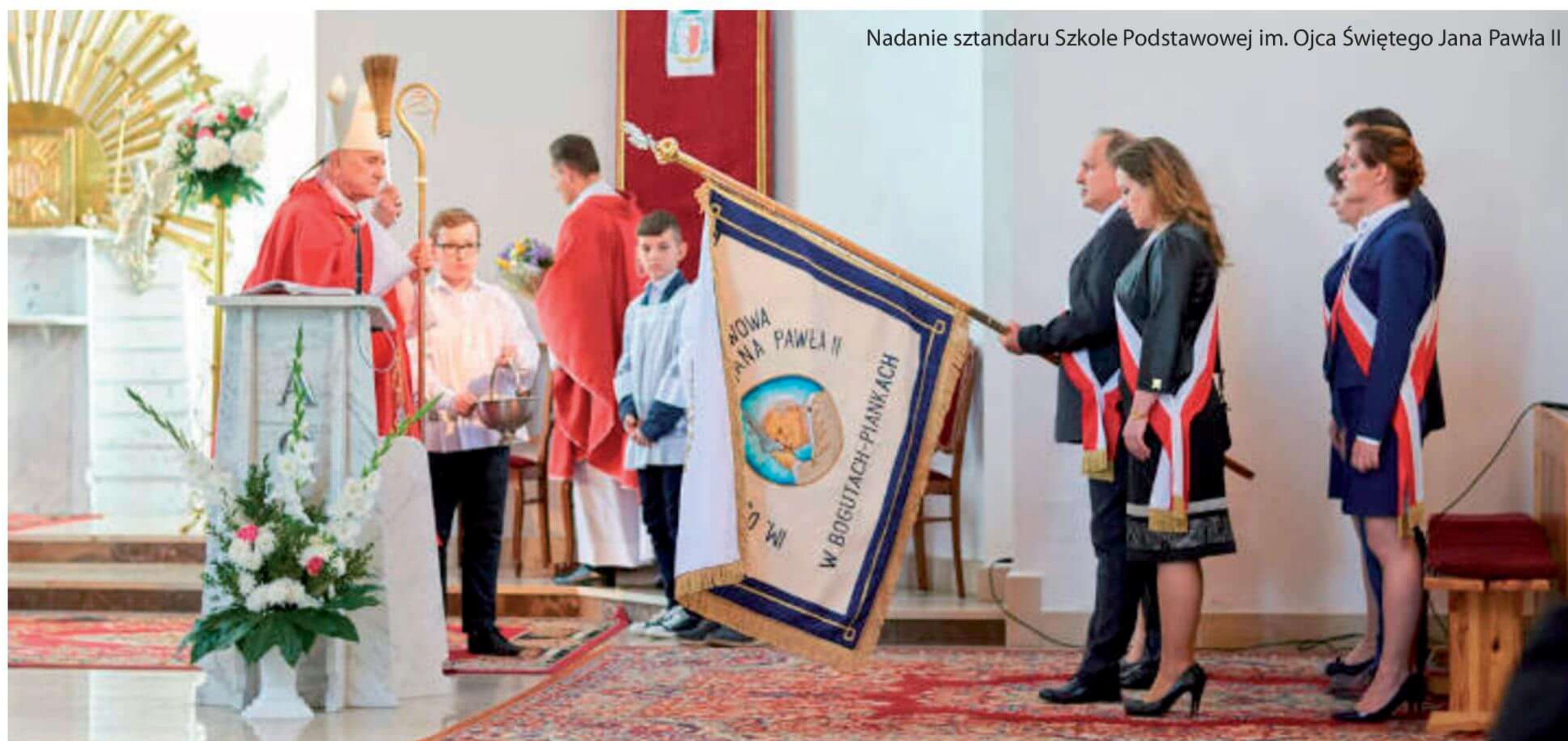
Nadanie sztandaru Szkole Podstawowej im. Ojca Świętego Jana Pawła II