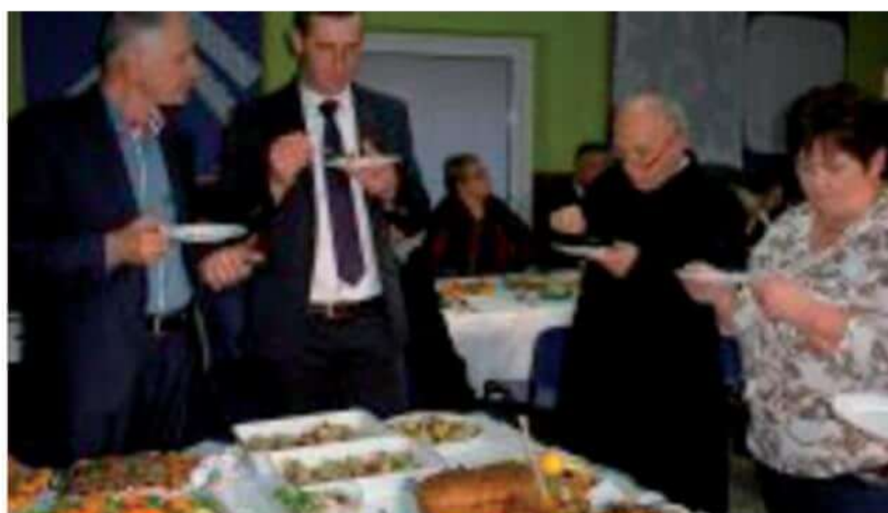
Degustacja potraw konkursowych