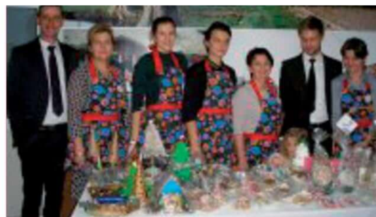
Stoisko rękodzieła bożonarodzeniowego przygotowane przez Koło Gospodyń Wiejskich w Tymiankach-Buciach