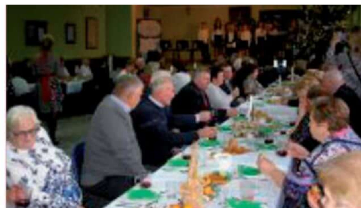
Seniorzy przy stole wigilijnym