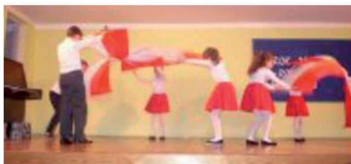
Uczniowie kl. I Szkoły w Bogutach w tańcu z flagami.

Kolejna część uroczystości odbyła się w sali widowiskowej Gminnego Ośrodka Kultury i Sportu w Bogutach-Piankach. Po wspólnym odśpiewaniu hymnu narodowego o godzinie 12 00 licznie zgromadzona publiczność obejrzała część artystyczną przygotowaną przez uczniów i nauczycieli szkół z terenu gminy. Akademia zakończyła się wspólnym śpiewaniem pieśni patriotycznych pod przewodnictwem Zespołu Żurawiacy.