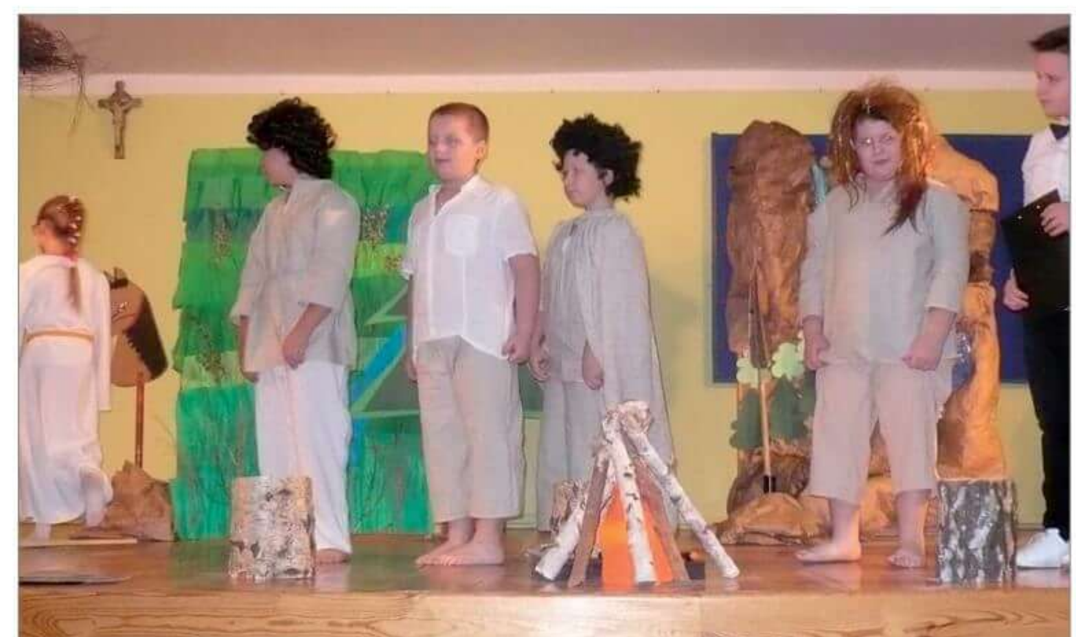
Występ uczniów klasy I podczas Święta Niepodległości 2019