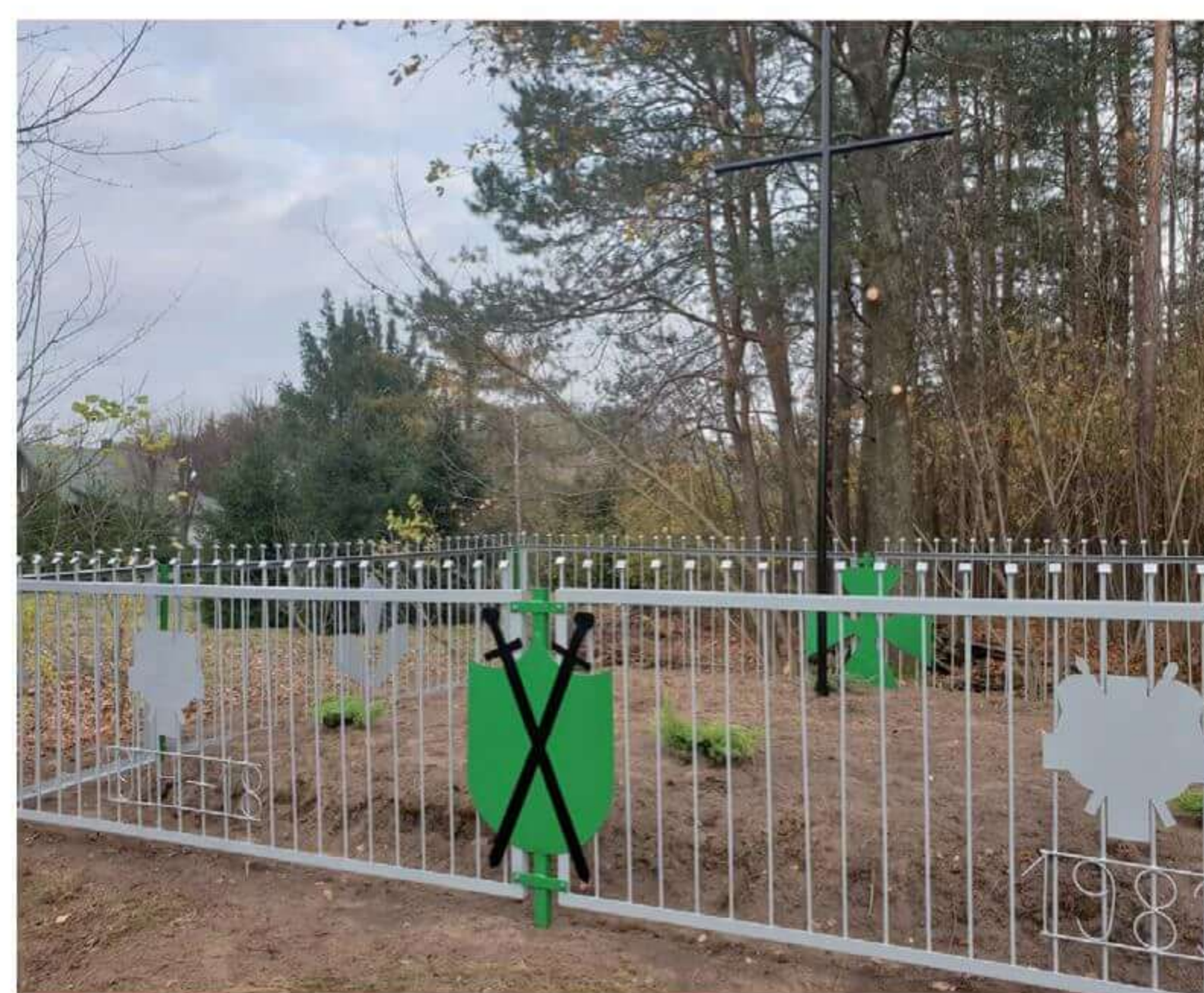
Mogiła po odnowieniu.

w roku 1915 r. pozostawiając za sobą poległych żołnierzy Armii Cesarstwa Niemieckiego i Armii Imperium Rosyjskiego. Byli to bardzo często Polacy wcieleni przez