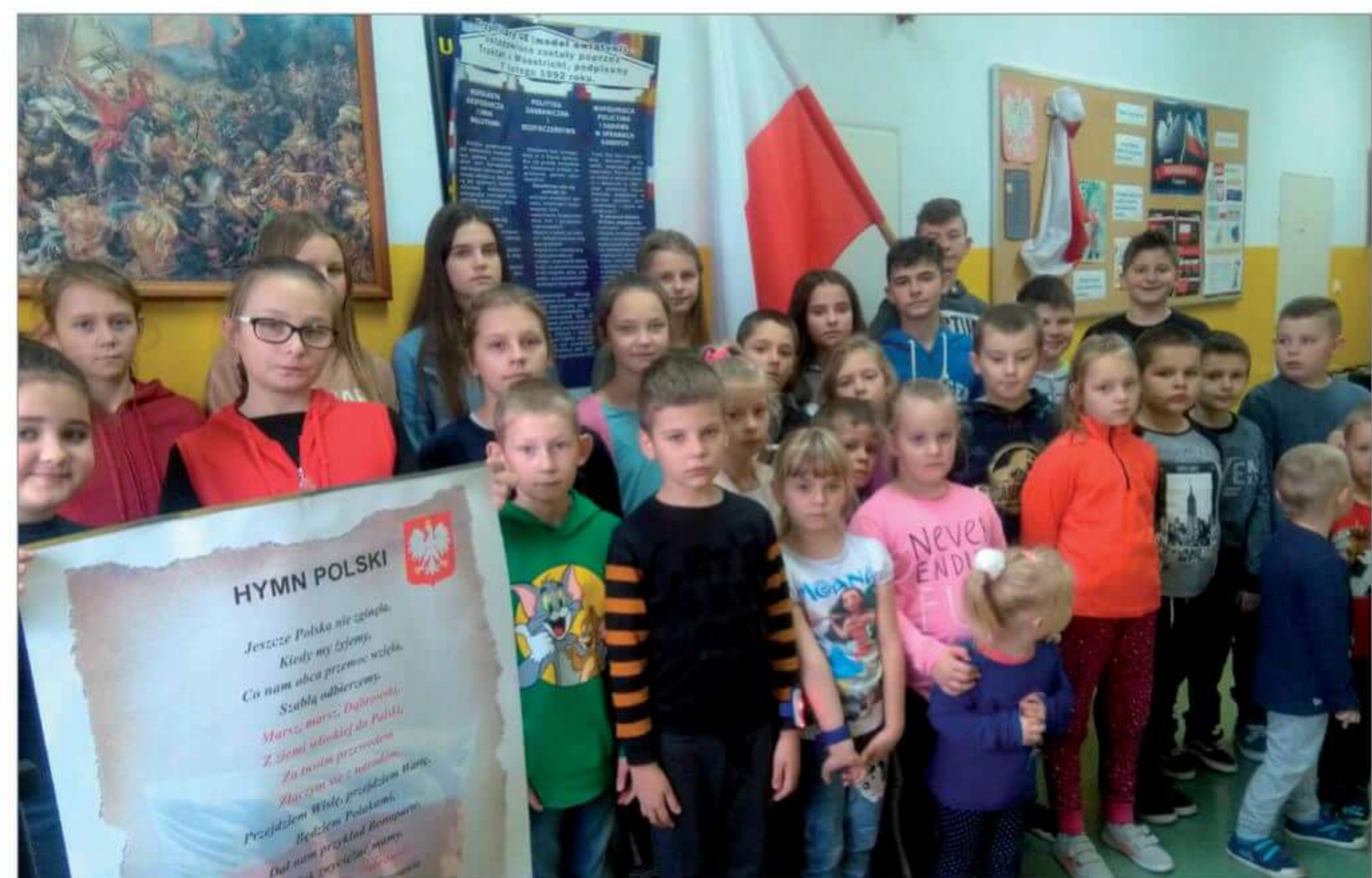
Akcja „Szkoła do Hymnu”.