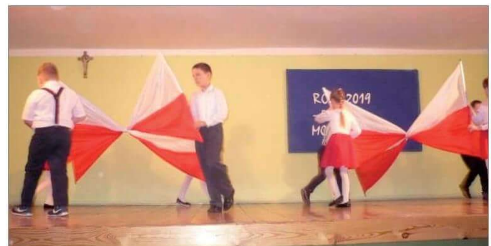
Uczniowie klasy I w Tańcu z flagami podczas Święta Niepodległości 2019.

niają wszelkie uroczystości szkolne m.in. Narodowe Czytanie, Dzień Babci i Dziadka, Święto Rodziny. Zespół prężnie działa w środowisku lokalnym. Tancerze występowali na Spotkaniach Kolędniczych, festynie pod wiatrakiem organizowanych przez GOKiS w Bogutach-Piankach. Barwne, krakowskie stroje oraz wdzięk artystów za każdym razem budzą podziw i uznanie publiczności. Zespół reprezentuje szkołę również poza granicami gminy. Dwukrotnie brał udział w przeglądach tanecznych w Starym Lubotyniu oraz występował gościnnie na Jarmarkach Św. Wojciecha i Św. Antoniego w Muzeum Rolnictwa w Ciechanowcu, także na Festynie „Wianki na Nurcu”. Prezentował się również w Sz. P. im. KEN w Klukowie z okazji 100 rocznicy Odzyskania Niepodległości. Gościnnie wystąpił w XXII Przeglądzie Zespołów Artystycznych Osób Niepełnosprawnych w Kozarzach.