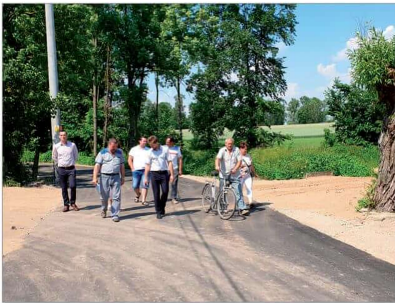
Droga gminna Zawisty-Wity.

nam się pozyskać w roku 2019 źródło finansowana poprzez Fundusz Dróg Samorządowych. Całkowity koszt inwestycji wyniesie ponad 600 tys. złotych z czego planowane dofinansowanie to 70% kosztów kwalifikowanych. Z pośród 5 oferentów wyłoniono wykonawcę, którą została firma P.W. WIKRUSZ z Miedznej. Podpisana z wykonawcą umowa opiewa na kwotę 599 641,21 zł i jest o około 120 tysięcy mniejsza od pierwotnie planowanej. Na dzień dzisiejszy inwestycja została zakończona.