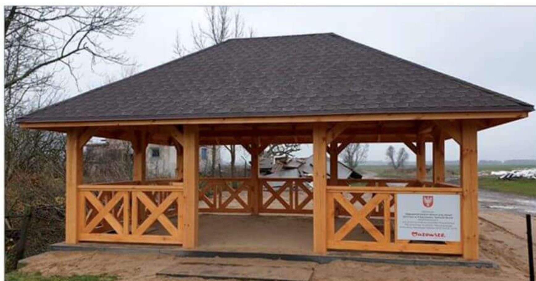
Inwestycja w ramach MIAS w Tymiankach-Buciach.