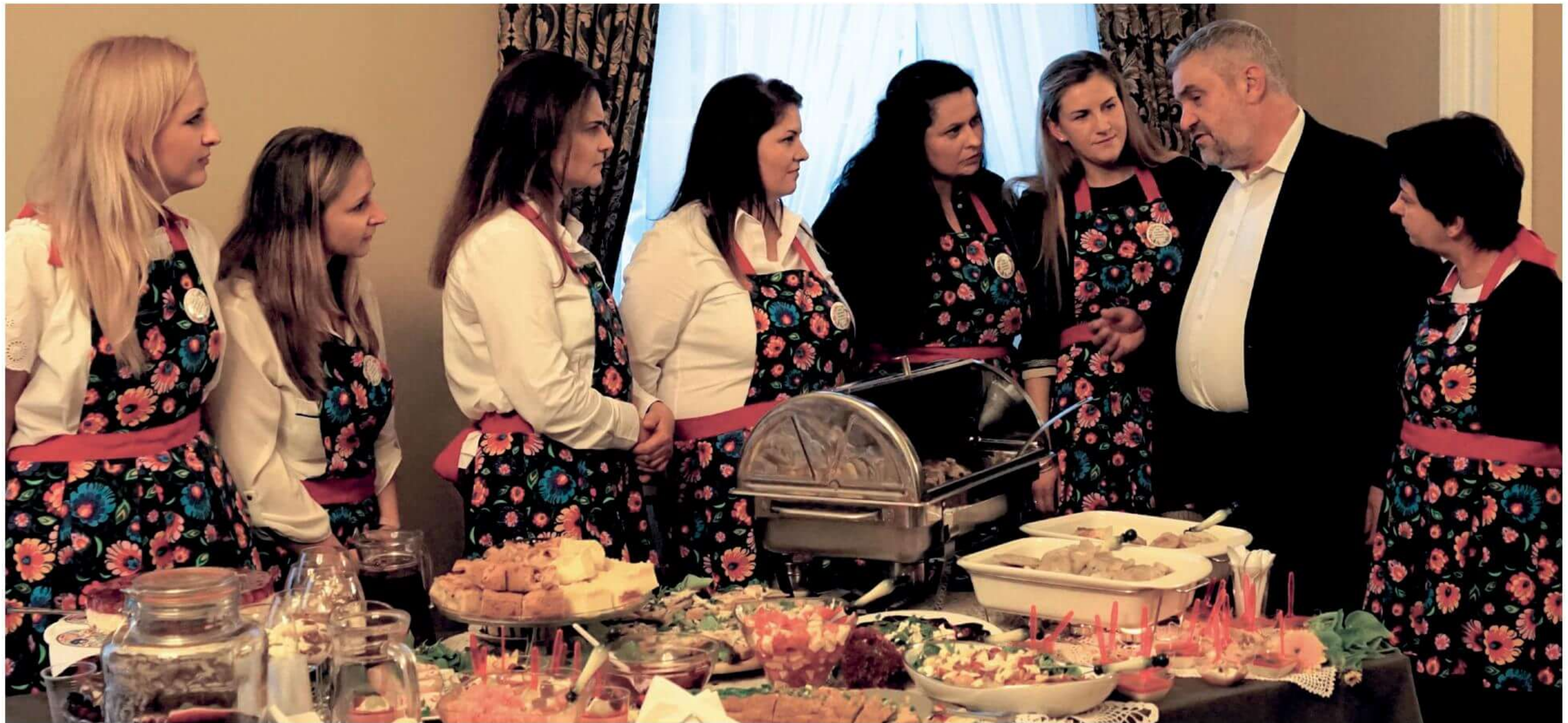
Spotkanie z Ministrem Rolnictwa Janem Krzysztofem Ardanowskim w Muzeum Rolnictwa w Ciechanowcu.

kinie wykonały wieniec dożynkowy, który zaprezentowano na Dożynkach Parafialnych w Bogutach-Piankach oraz na imprezie gminnej „Spotkanie pod wiatrakami”, gdzie wspólnie z Gminnym Ośrodkiem Kultury i Sportu, Urzędem Gminy, OSP oraz Klubem Seniora członkinie koła włączyły się w przygotowanie poczęstunku dla uczestników i gości.