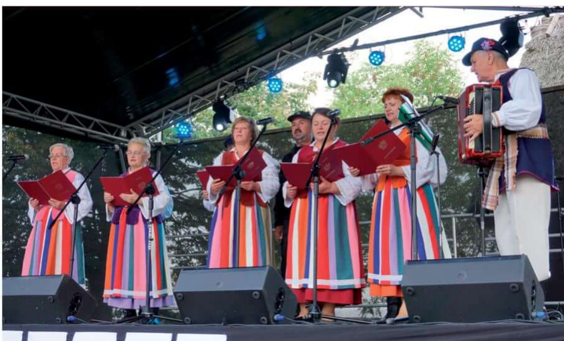
Występ Zespołu Żurawiacy.

Każdy uczestnik spotkania znalazł coś dla siebie. W programie imprezy były występy artystyczne dzieci i młodzieży ze szkół podstawowych gminy Boguty-Pianki. Miłośnicy ludowego śpiewania mieli okazję posłuchać zespołów ludowych i śpiewaczych. Wystąpili min.: Laskowianki, Nadbużanie, Kwiaty Polskie, Żurawiacy. Swój wokalny talent