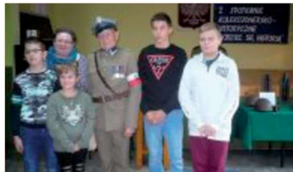
Uczniowie Szkoły Podstawowej w Tymiankach-Buciach