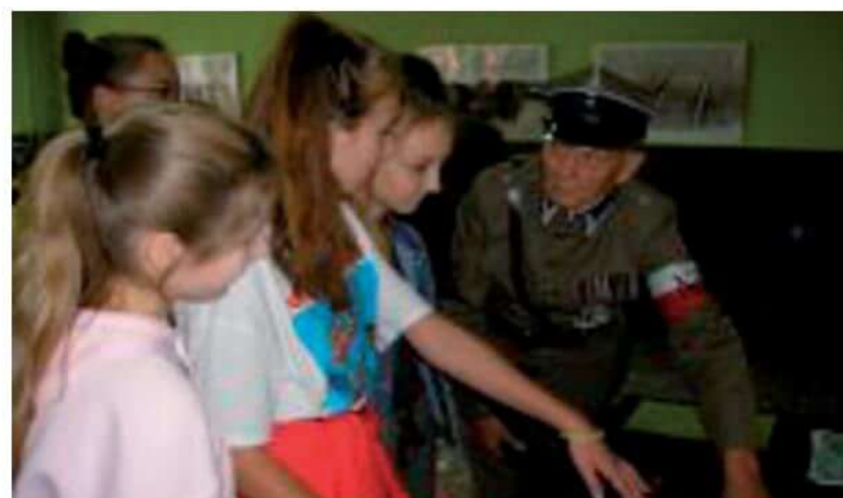
Uczniowie Szkoły Podstawowej w Bogutach-Piankach.

W związku z 80 rocznicą wybuchu II wojny światowej 4 października w Gminnym Ośrodku Kultury i Sportu odbyło się I Spotkanie kolekcjonersko-historyczne „Podziel się historią” połączone z otwarciem wystawy pt. „Wojna 1939-1945 we wspomnieniach mieszkańców Ostrowi Mazowieckiej i okolic” udostępnionej przez Bibliotekę Miejską w Ostrowi Mazowieckiej.